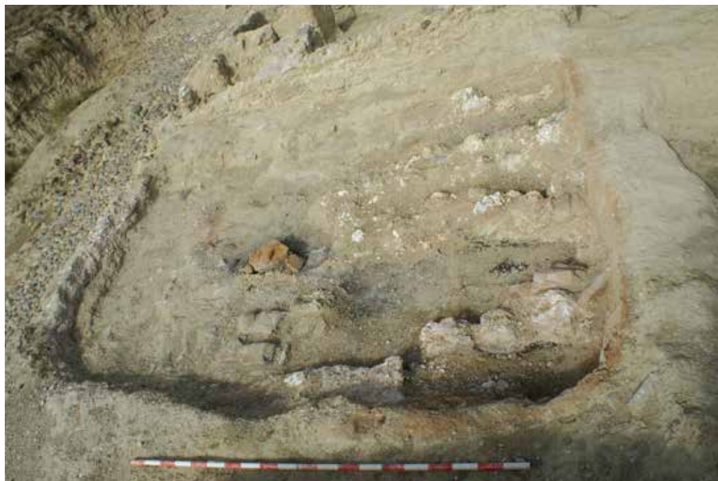
Figura 1. Imagen de la parrilla del horno en el proceso de excavación en 2017.

de la vivienda, que en este caso no parece mostrar subdivisiones internas, aunque hay que tener en cuenta que se interviene en una franja estrecha que no llega a suponer la anchura total de la misma, ya que por la propia configuración del terreno la potencia de los niveles de colmatación supera el metro de altura. Se trata de limos de colmatación formados por arcillas y posiblemente restos de adobe o tapial deshechos, de gran dureza y prácticamente estériles en cuanto a material arqueológico. Cabe destacar la localización de una mancha de carbones sobre los niveles de escombro de derribo que parece denotar una reocupación tardía, o al menos alguna estancia esporádica en lo que ya sería un poblado en ruina progresiva.