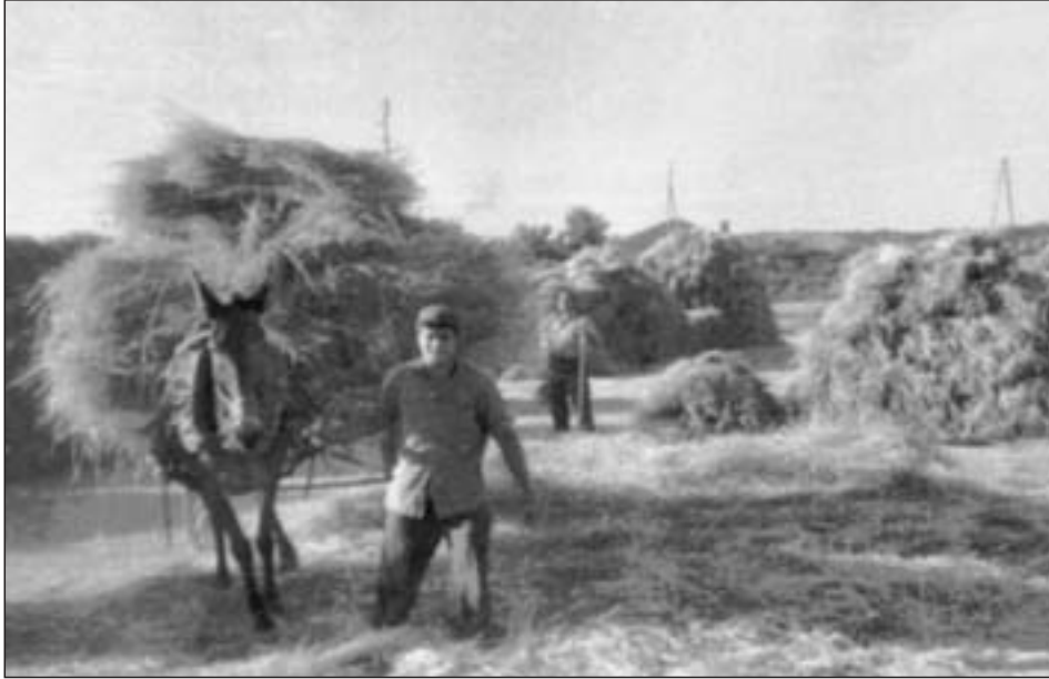
Detalle de la distribución de la mies en la era

bía que tapar todo con mantas, y si las lluvias eran persistentes incluso llegaban a germinar algunos granos que se mojaban. Una vez conseguida la separación, se procedía al “cribado”, pues junto con el grano había impurezas que era necesario separar; para ello, se utilizaban unos cedazos o “cribas” especiales de agujeros grandes para la cebada y pequeños para el trigo, y se pasaba todo el grano. Estas operaciones las realizaban normalmente las mujeres, junto con el barrido de la era con unos escobones que se hacían con unas matas cogidas en el campo y atadas con una cuerda.