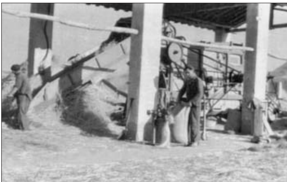
Detalle de la máquina trilladora en pleno trabajo

Tenían un rendimiento de 700 a 1000 kg por hora.