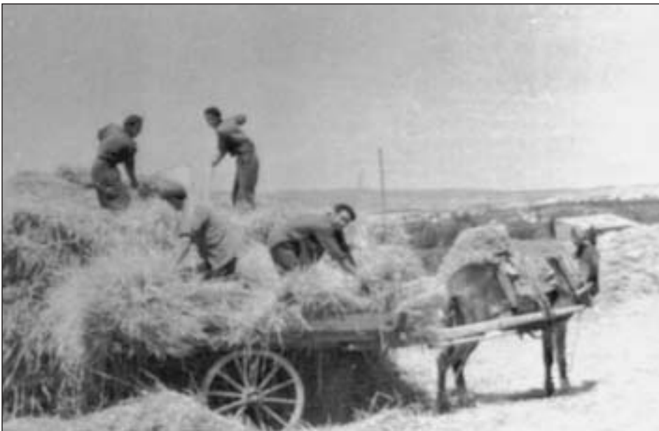
Detalle de la carga de la mies para su transporte a la era

Los carros o las galeras (carros de cuatro ruedas), se armaban con puntas de madera para darles más capacidad, así como en la parte baja del carro, donde se ponía una tabla llamada “bolsa” para lo mismo. Estos carros o galeras iban tirados por una, dos, tres o cuatro caballerías, según el peso de la carga. Una vez cargado el carro, se procedía a atarlo sujetando la carga con una sogá (cuerda gruesa) y se tensaba el máximo posible ayudado con una corredera de madera llamada “barzón”. Si durante el camino, debido al mal atado, se aflojaba la carga y se caían algunos “fajes”, se decía que había hecho “borrego”. Así se llegaba a la “era”, superficie de terreno situada en las afueras de los pueblos, con forma circular y muy llana, en un paraje alto y despejado para favorecer el movimiento del viento. Además todas las “eras” disponían de una caseta para guardar los diferentes útiles o aparejos, la paja y a veces para refugio.