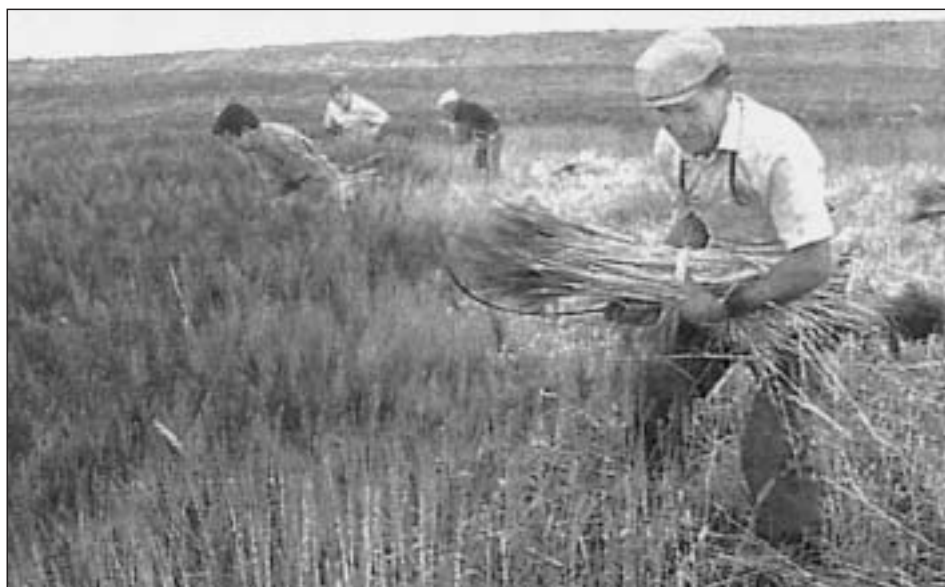
Detalle de la siega manual a pleno rendimiento

A la mañana siguiente, la primera operación era el “afascalado”, recogiendo los “fajes” para la mejor conservación y defensa contra las tormentas y vientos fuertes, pues era mucho el tiempo que duraba la siega. Esta operación se hacía a primera hora, pues la mies cogía “correa” (estado del cereal en el que debido a la humedad matinal se encuentra más flexible), y de esta manera no se desgranaban las espigas. Con los “fajes” se formaban los “fascasles” (montones) de 15 en 15 en forma de pirámide con la disposición de 5, 4, 3, 2 y 1; cuanto más grande era la finca, más “fascasles” se hacían y se facilitaba el transporte, conocido como “acarreo”, hasta la “era”. La posición de los “fajes” en el “fascal” tenía su técnica: se ponía de tal manera que las espigas quedasen lo más ocultas posible para protegerlas de posibles tormentas de piedra. Cada 20 “fajes” se llamaba una “carga”, y así se decía que tal finca ha tenido equis “cargas”, o también para cargar el carro con equis “cargas”.