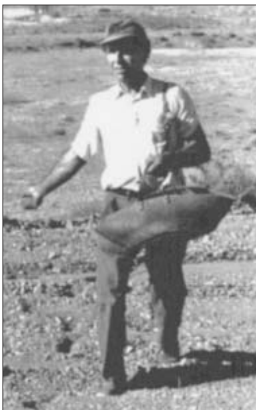
Sembrado a boleó

A la salida del invierno, si los sembrados tenían malas hierbas, se hacía una “escarda” con unas azadillas pequeñas (escardillas).