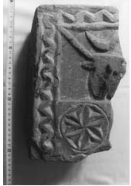
Estela romana. Artajona