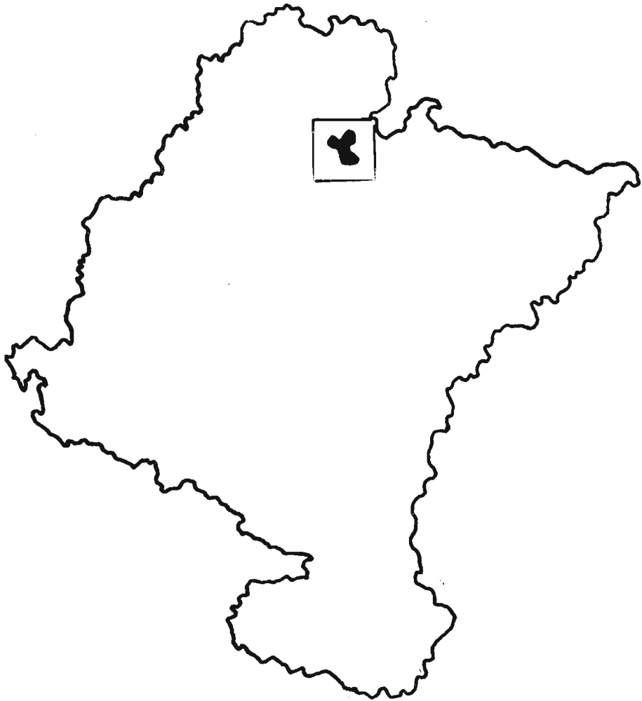
Figura 1: Localización de Eugi

No podemos terminar esta introducción sin dar las gracias a la ayuda prestada por los informantes para la realización de este trabajo sin la cual no hubiera podido llevarse a cabo. (Fig. 1).