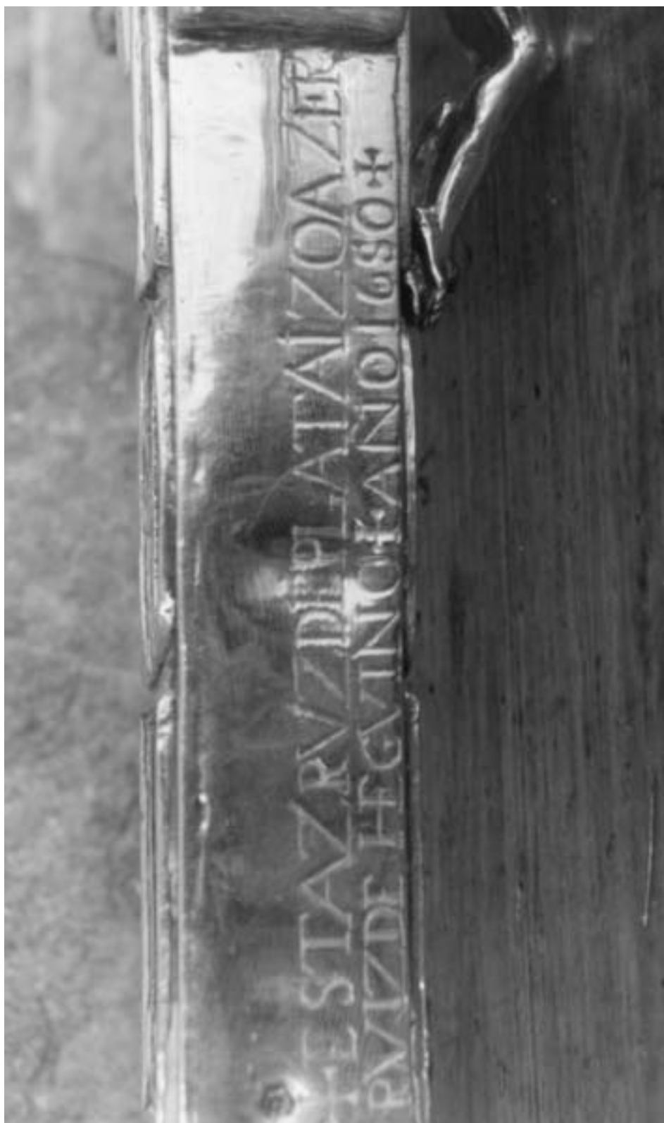
Fig. 2. Cruz procesional. Inscrición en el lateral.