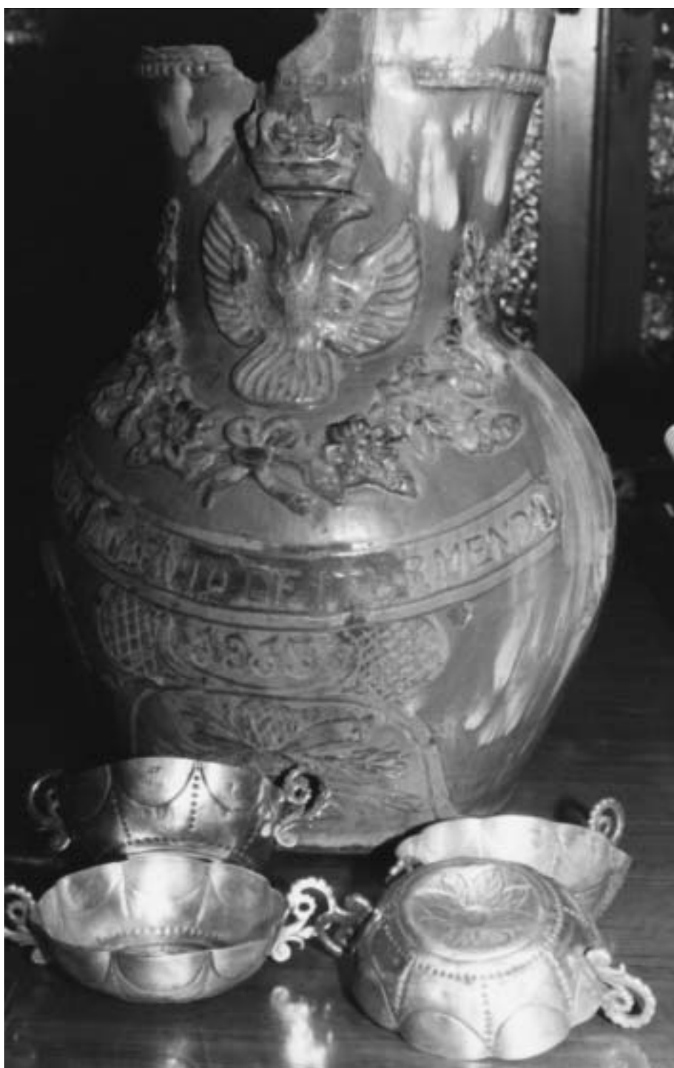
Fig. 4. Jarra y cuatro tazas de plata para el reparto de vino en las fiestas.