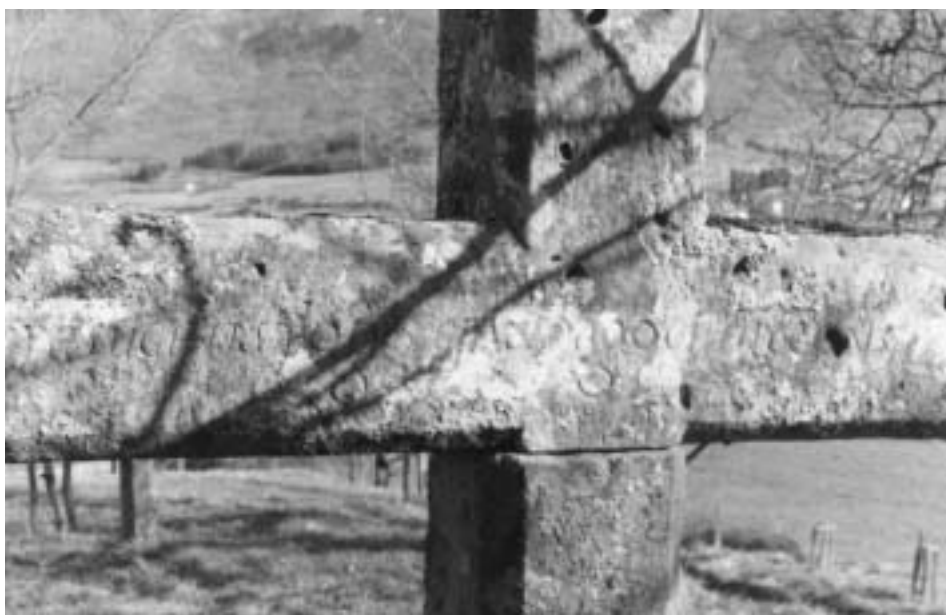
Fig. 5. Una de las cruces del Viacrucis, entre Iturmendi y la ermita de Aitzaga.