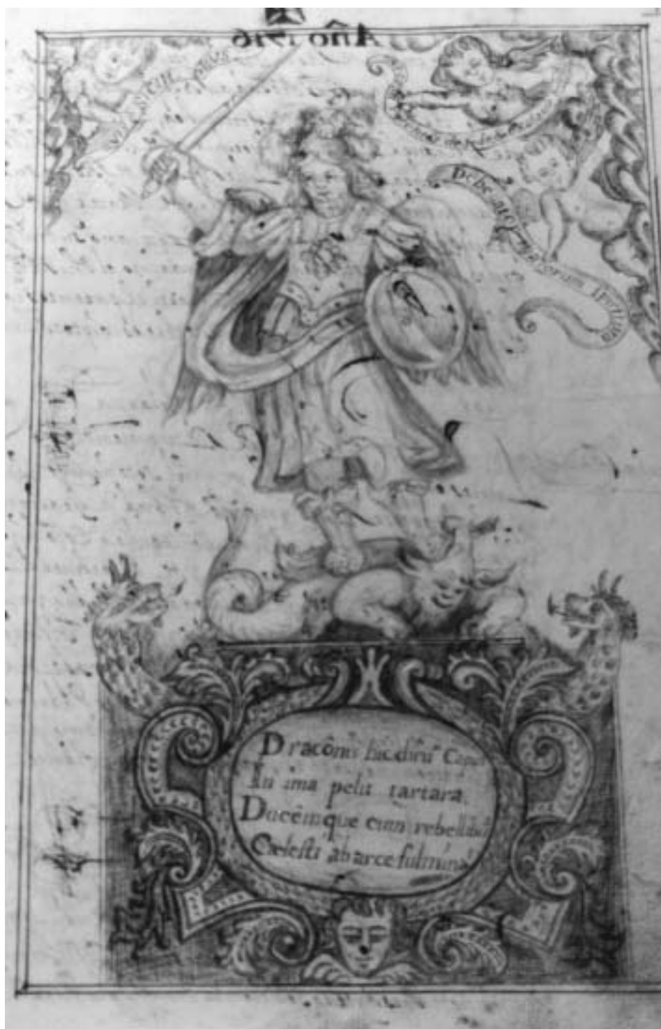
Fig. 3. Página introductoria del tercer libro de bautismos de la parroquia.