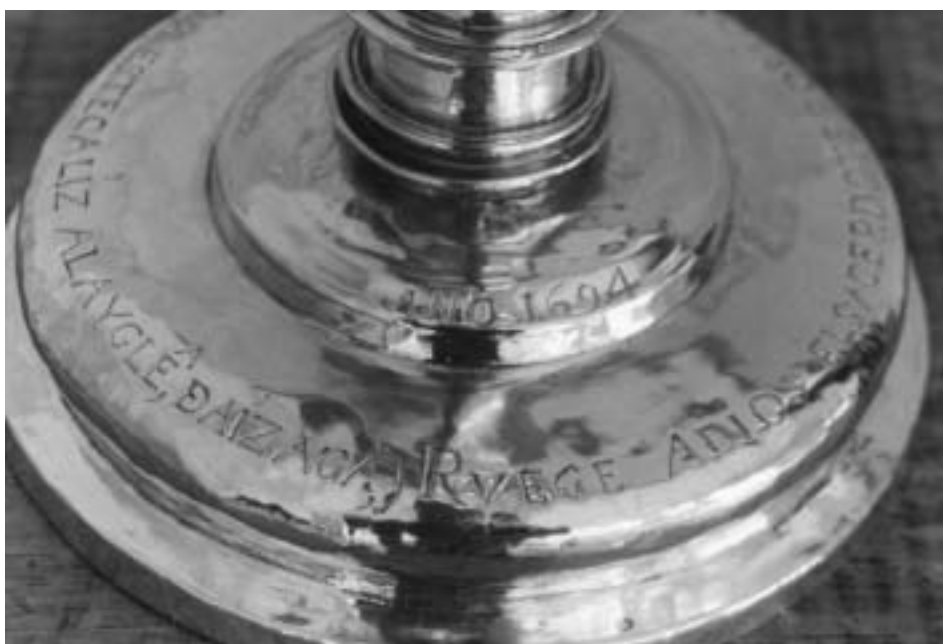
Fig. 1. Inscripción en el cáliz de Aitzaga.

La tradición popular nos dice que un arriero (quizá con el apodo de “el valenciano”) fue asaltado por forajidos que lo mataron en ese lugar 6 .