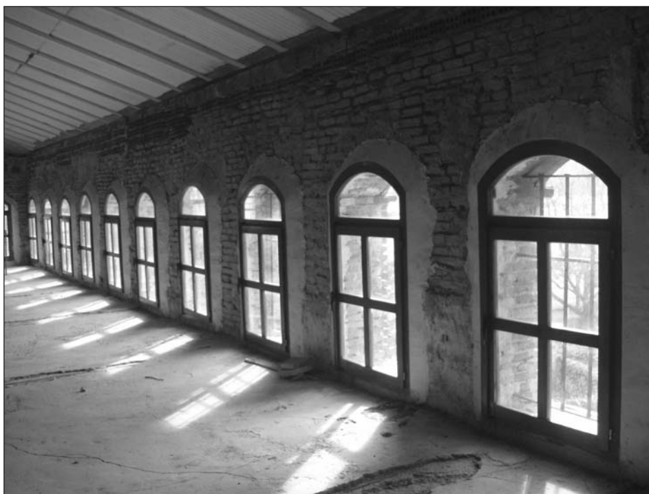
Galería de arquillas de ladrillo en la fachada sur del palacio, dando a la huerta y sirviendo de solana