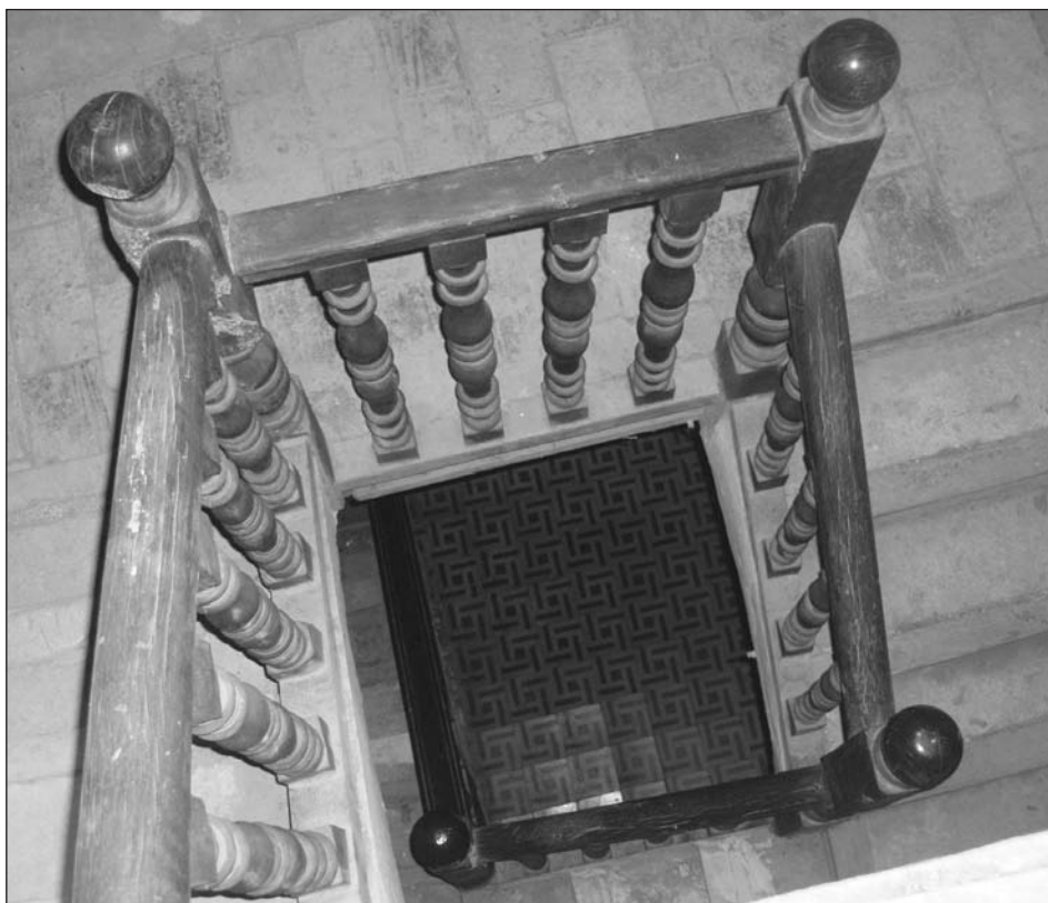
Vista cenital de la escalera principal del palacio