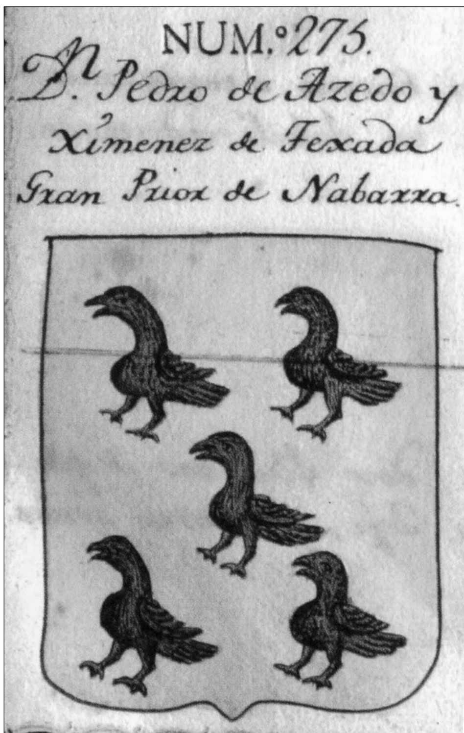
El Gran Prior de Navarra tomó las armas del Palacio de Acedo