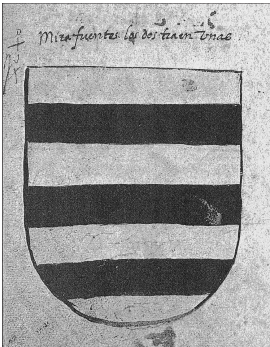
De oro, tres franjas de sable (Libro de Armería del Reino de Navarra)