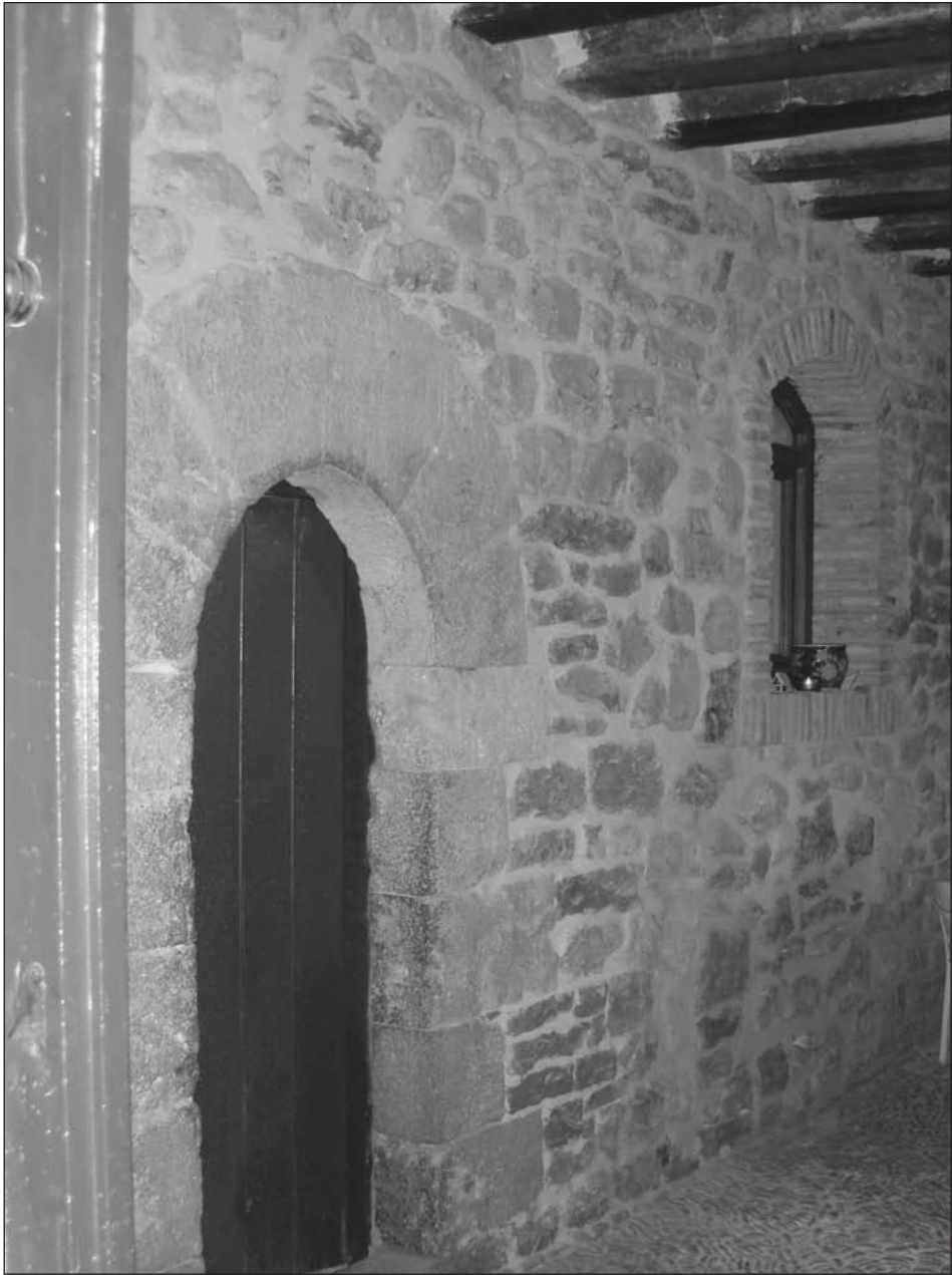
Puerta con arco de medio punto, ubicada en el vestíbulo empedrado del palacio