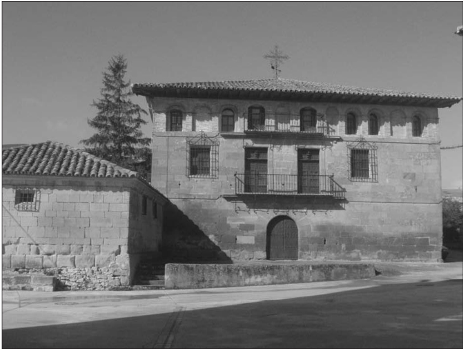
Fachada principal del Palacio de Acedo en su estado actual