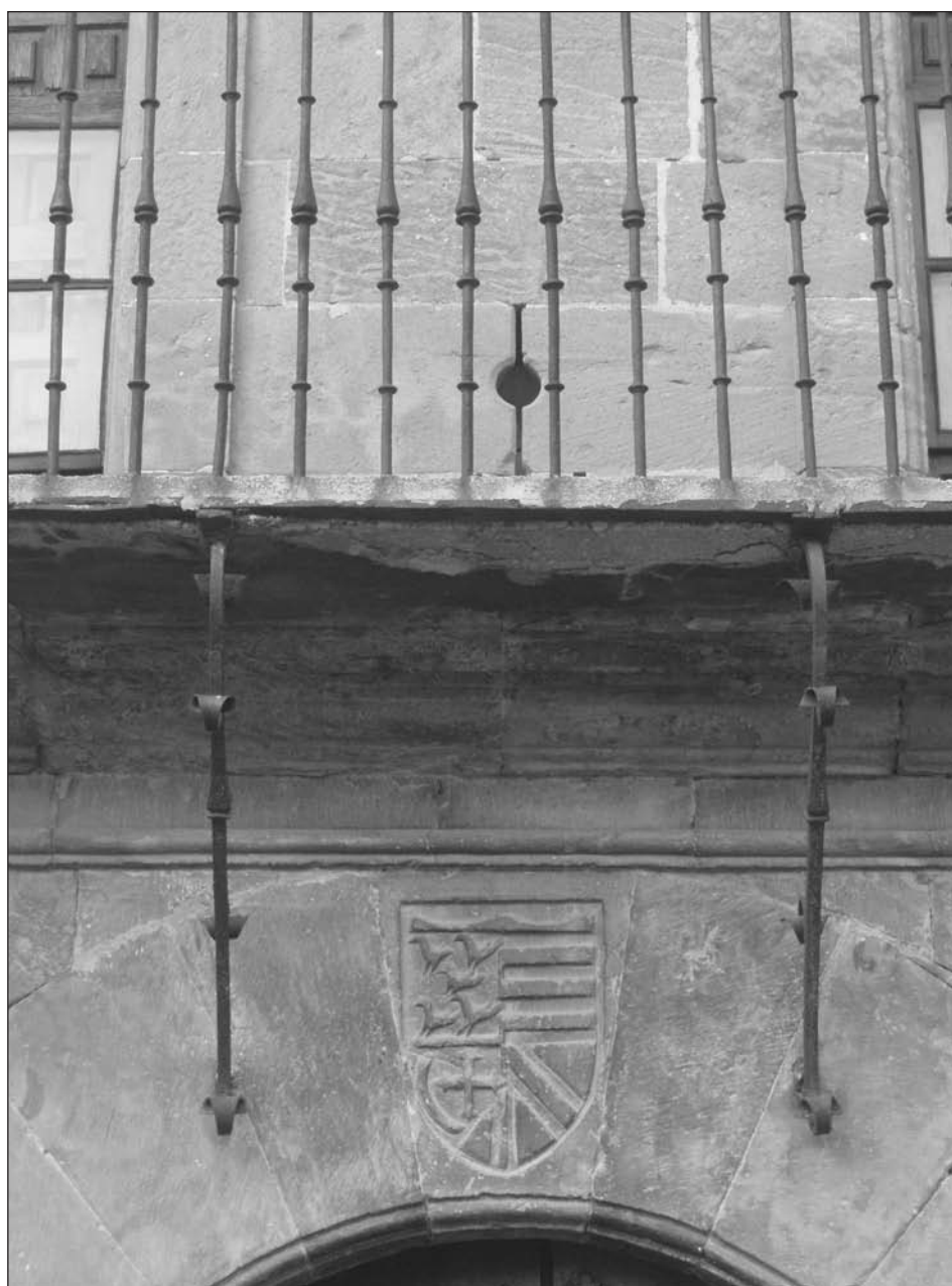
Clave del arco en la puerta principal, que luce las armas de los Acedo. Detalle de la forja del balcón y su saetera