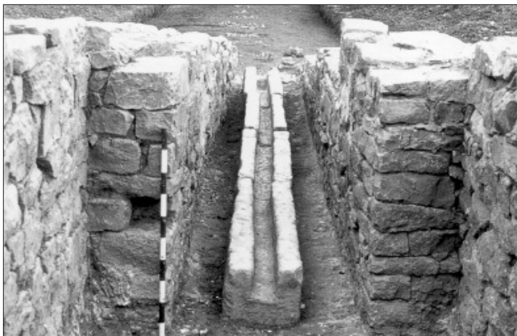
Foto 2. Andelos. Depósito regulador. Salida del acueducto