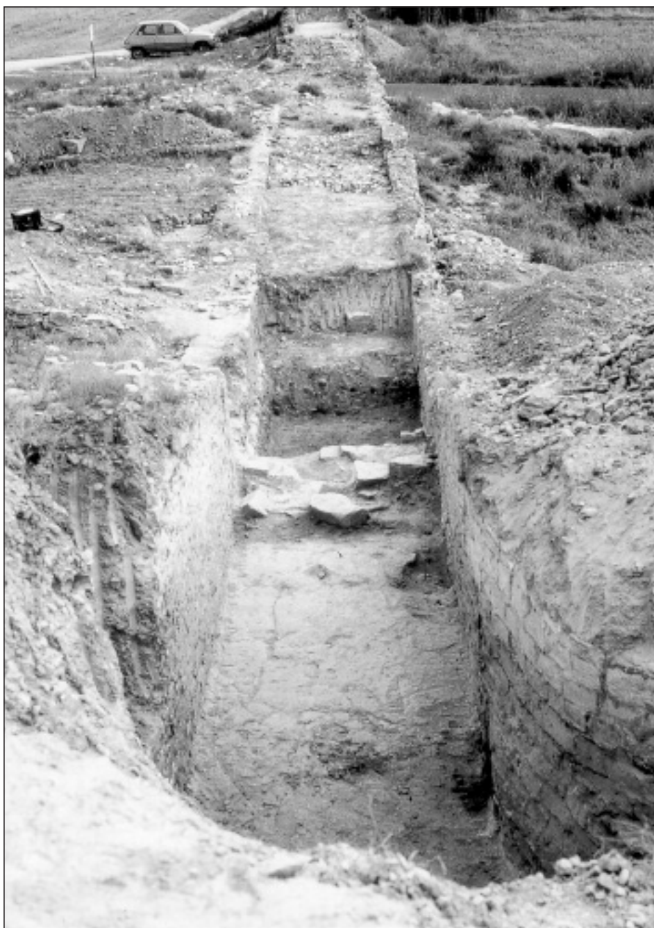
Foto 4. Lodosa. Canal romano