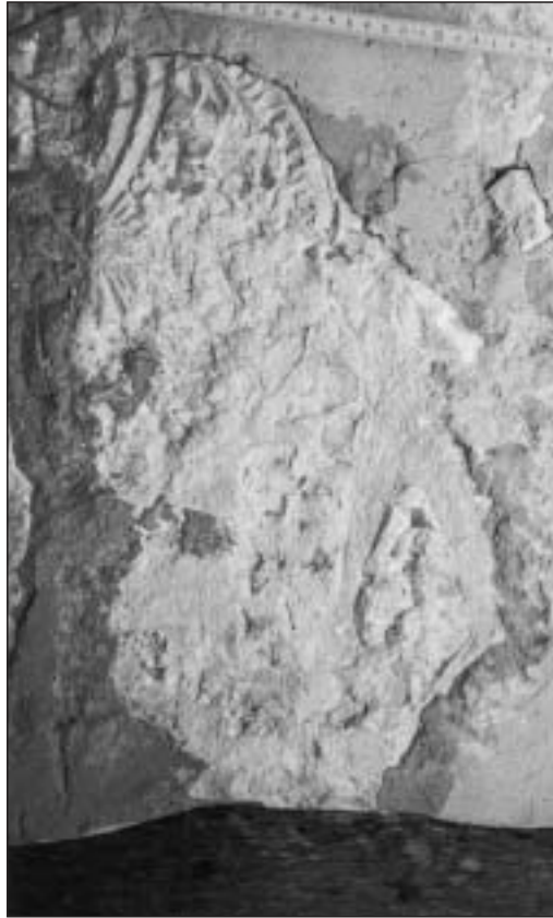
Fotografía 1. Inscripción número 1. Ermita de San Sebastián de Gastiáin