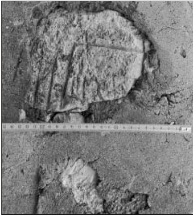
Fotografía 4. Inscripción número 4. Ermita de San Sebastián de Gastián

A la izquierda se observa un baquetón doble en relieve y a la derecha parte de la cartela que correspondería a la parte superior izquierda del campo epigráfico, en el que se aprecian rasgos de dos letras.