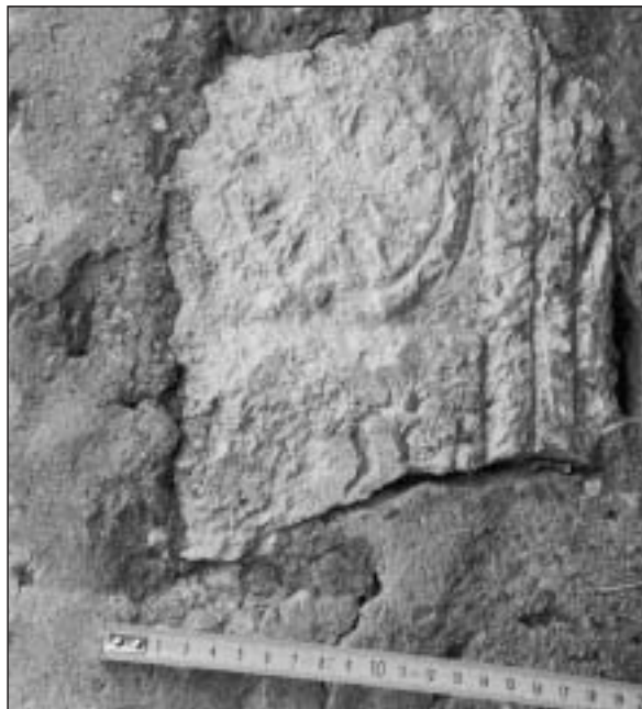
Fotografía 3. Inscripción número 3. Ermita de San Sebastián de Gastiáin

Decoración: Disco bordeado por cenefa, debajo del cual se encuentra parte del campo epigráfico enmarcado por cartela, en el que se aprecian rasgos de letras. En el lado derecho se puede observar un baquetón doble que enmarcaría todo el conjunto.