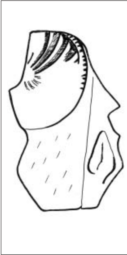
Dibujo 1. Inscripción número 1. Ermita de San Sebastián de Gastiáin