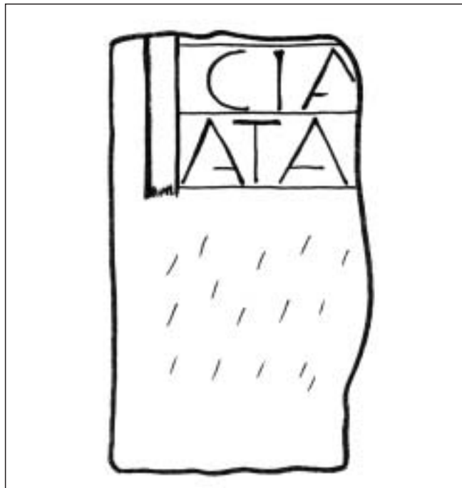
Dibujo 3. Inscripción número 5. Ermita de San Sebastián de Gastiáin

Número 6 (6a, 6b). En la pared este y sur.