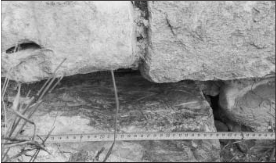
Fotografía 5. Inscripción número 5. Ermita de San Sebastián de Gastiáin