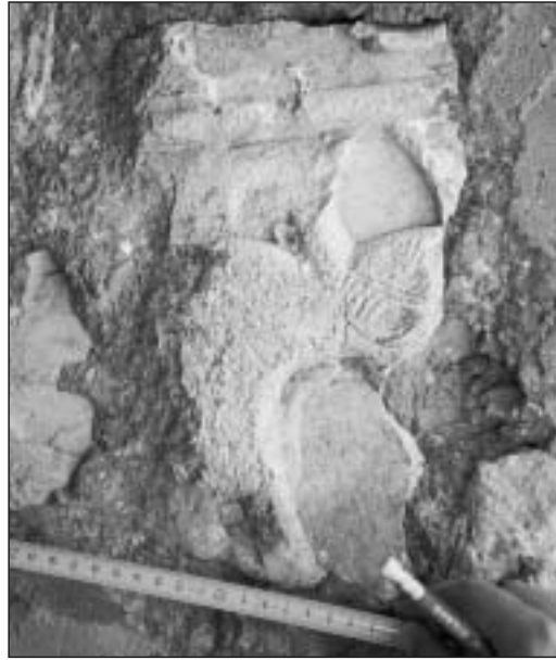
Fotografía 2. Inscripción número 2. Ermita de San Sebastián de Gastiáin