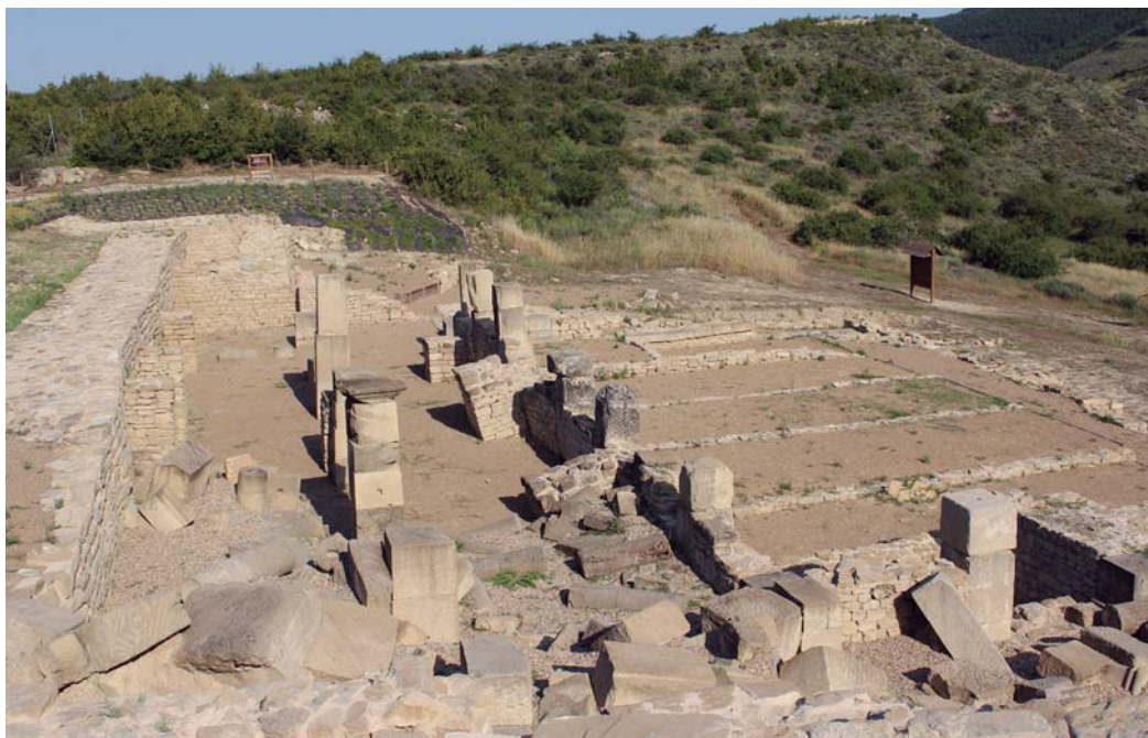
Figura 2. Vista del criptopórtico y el almacén.

En la parte sur del foro, y adosadas contra el muro de cierre del criptopórtico, se ubican una serie de estancias alargadas, que aunque han sido interpretadas como