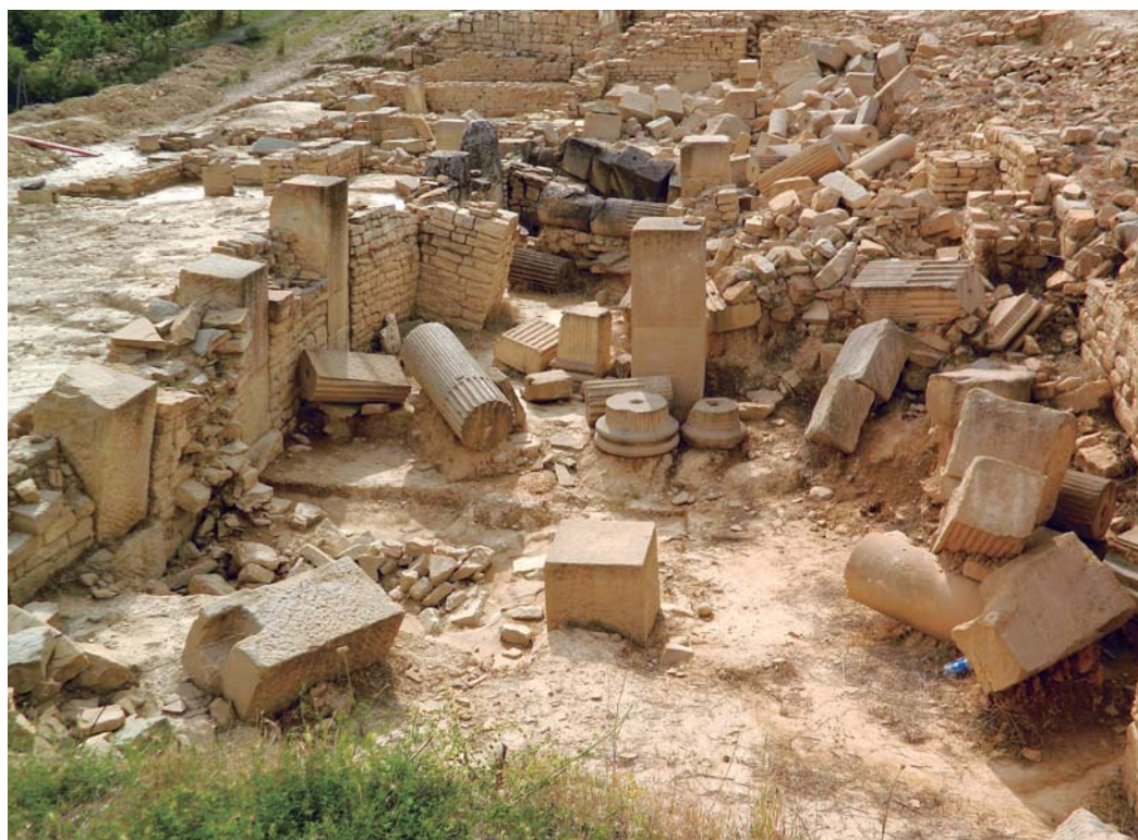
Figura 1. Vista general del criptopórtico de Santa Cruz de Eslava.

en una fase posterior con la introducción de otros nueve machones a ambos lados de los dos centrales de la fase precedente. El muro de opus vittatum ciega toda la estructura dando mayor solidez a la construcción. Además, hacia el interior de la sustructio , la estructura se ve reforzada por contrafuertes interiores en los lados norte y sur (Armen-dáriz & Sáez de Albéniz, 2016, p. 251). Esto nos puede indicar que la reforma es la consecuencia de problemas estructurales en el edificio en la fase precedente. Además, en esta fase también se refuerza uno de los machones centrales (Armen-dáriz & Sáez de Albéniz, 2016, p. 267), lo que nos vuelve a llevar a la hipótesis anteriormente planteada.