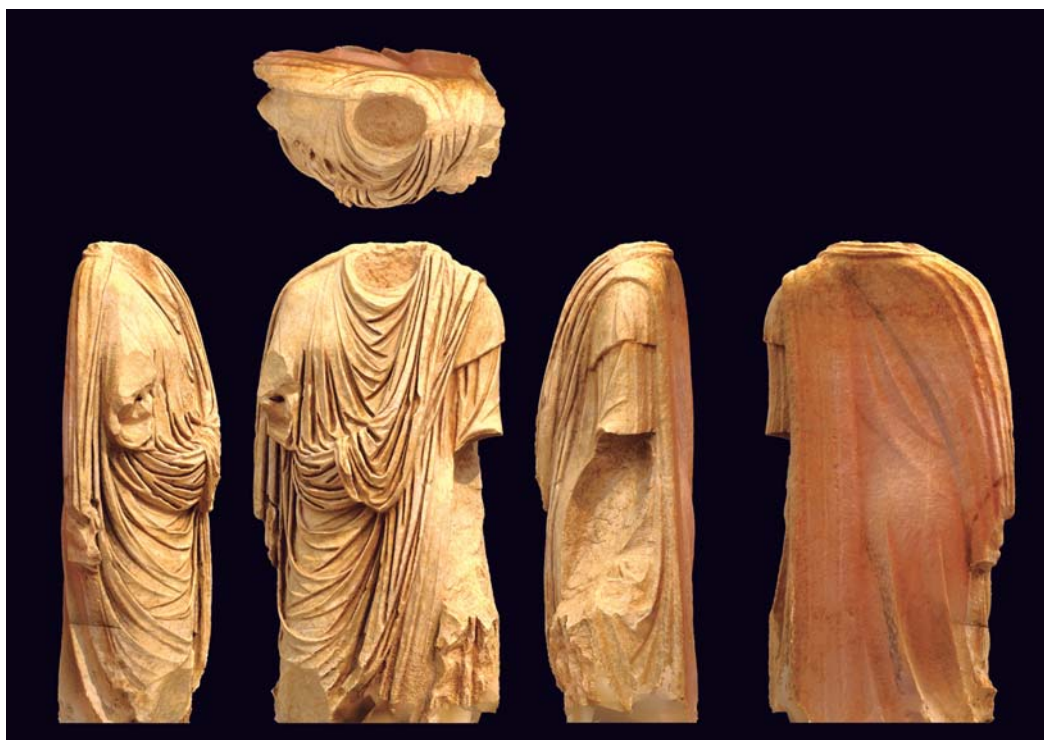
Figura 4. Diversas vistas del togado acéfalo de Santa Cruz de Eslava.

En cuanto al togado 2 (fig. 4), se trata de una representación acéfala realizada en mármol blanco de grano fino y en buen estado de conservación, aunque le faltan la cabeza, las manos y los pies. Tiene unas dimensiones de 140 cm de largo x 61 cm de ancho x 33 cm de profundidad. Presenta algún desperfecto en su lado izquierdo, en el que se han perdido algunos pliegues de la toga. Estos combinan algunas zonas de poco volumen –zona derecha– con otras de amplios volúmenes y uso del trépano. Tipológicamente, y a espera de un estudio más detallado, puede adscribirse al típico togado de época imperial con umbo en forma de U, del tipo Ba, según la clasificación tipológica de H. R. Goette (1990, pp. 29-54). Más concretamente, la presencia de un