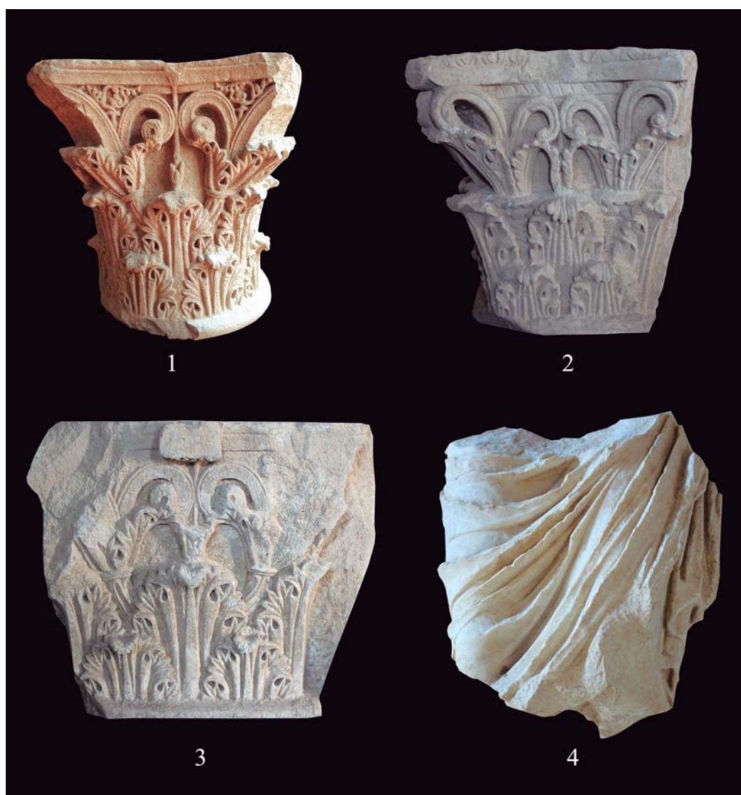
Figura 3. 3.1. Capitel corintio de columna. 3.2. Capitel corintio de pilar. 3.3. Capitel corintio de pilastra. 3.4. Representación tipo Hüftmantel.

El estilo del Segundo Triunvirato, con la presencia de rosetas, se dio en Roma entre los años 30-20 a. C., sobreviviendo en algunos casos hasta el cambio de Era. Sin embargo, en las provincias occidentales, la cronología de los mismos sobrevivió bien entrado el s. I d. C. (Trunk, 2008, 21). Esto concuerda con la cronología del criptopórtico, construido en el primer cuarto del s. I d. C. (Armendáriz & Sáez de Albéniz, 2016, p. 254). Estaríamos, por tanto, ante el programa decorativo original del primer foro, erigido muy probablemente en época de Augusto. En cuanto a los elementos en orden toscano, destaca, a espera de un estudio detallado de los mismos, el gran parecido de algunas piezas con la decoración arquitectónica de la basílica de Los Bañales (Romero, 2017, pp. 117-123).