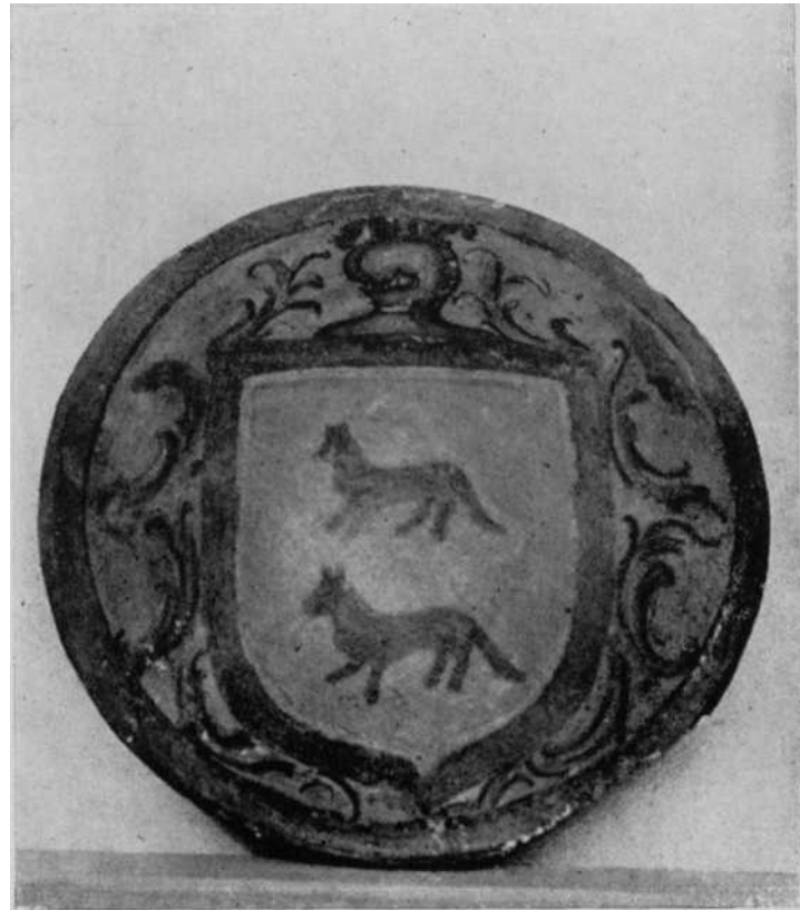
Rodela con las armas del Palacio de Ochovi.