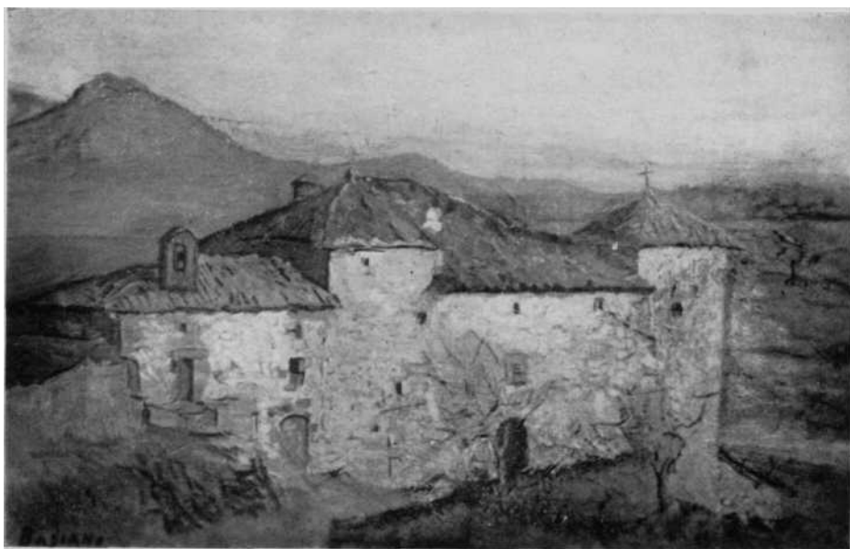
El Palacio de Ochovi. Oleo de Basiano.