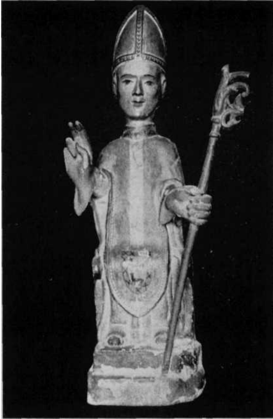
Palacio de Ochovi. San Martín, Patrono de la Capilla. Fines del XIV.