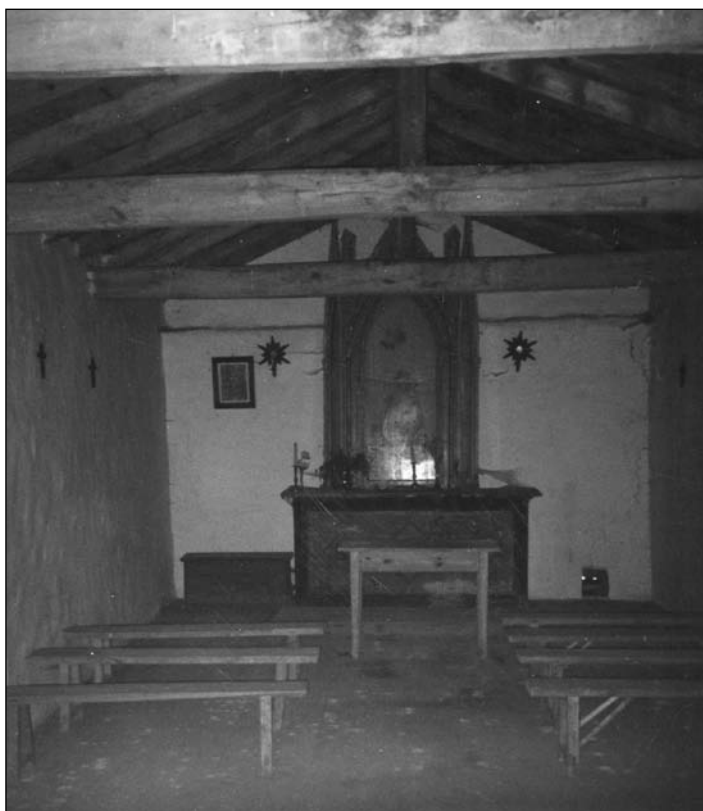
Lámina 2. Interior