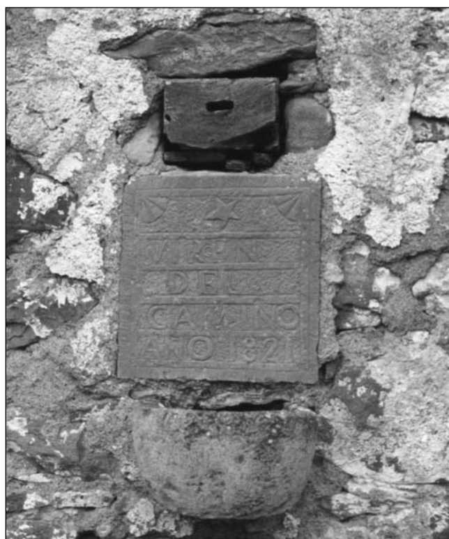
Lámina 3. Aguabenditera desaparecida