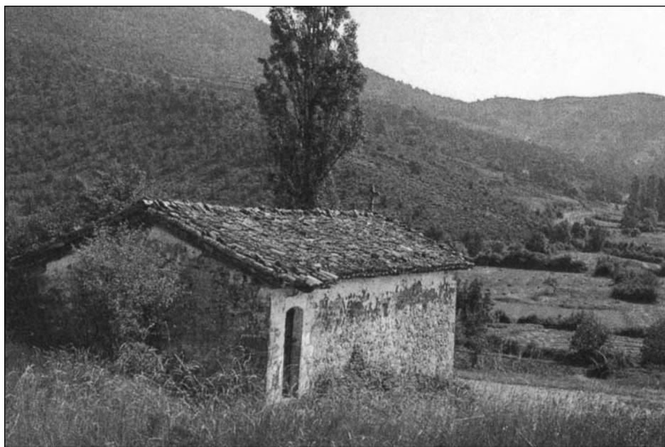
Lámina 5. Vista general de la ermita (PÉREZ OLLO, F., Ermitas de Navarra , Pamplona, 1983, p. 176)