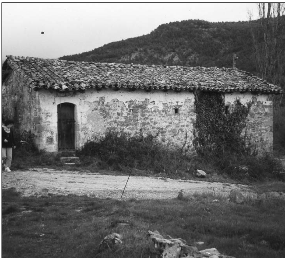
Lámina 1. Exterior

Estaba situada al pie de la antigua carretera, hoy desaparecida, en dirección a Burguete, a 300 metros del pueblo (Láminas 1, 5 y 7). Era de características rurales, de nave rectangular 5 , con cubierta a dos aguas sujeta por vigas de madera. La entrada se encontraba en uno de los lados largos orientada hacia el sur. En cuanto a los vanos, tenía tres pequeñas ventanas abocinadas, dos junto a la puerta que daban luz a la nave y otra en la parte trasera (Lámina 6). En el interior (Lámina 2) se veneraba a la Virgen del Camino, una talla del siglo XVI, actualmente vestida, aunque mantiene la policromía dorada de la época. También hay que mencionar un crucificado barroco 6 .