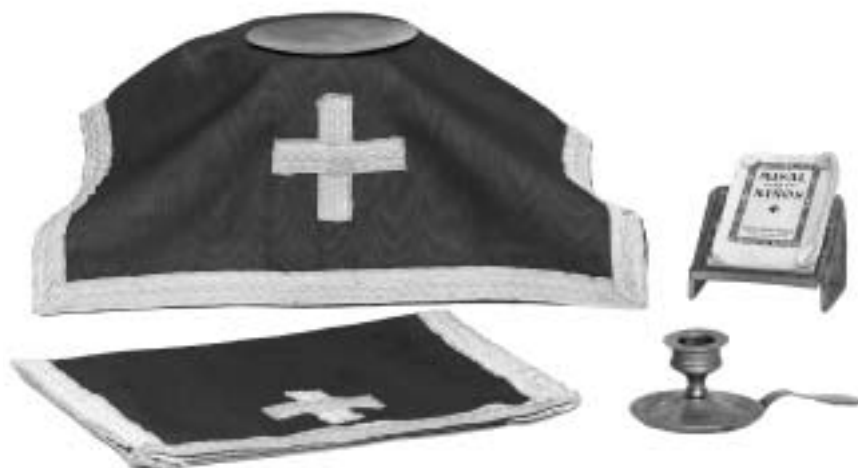
Disfraz de cura de los años 1950