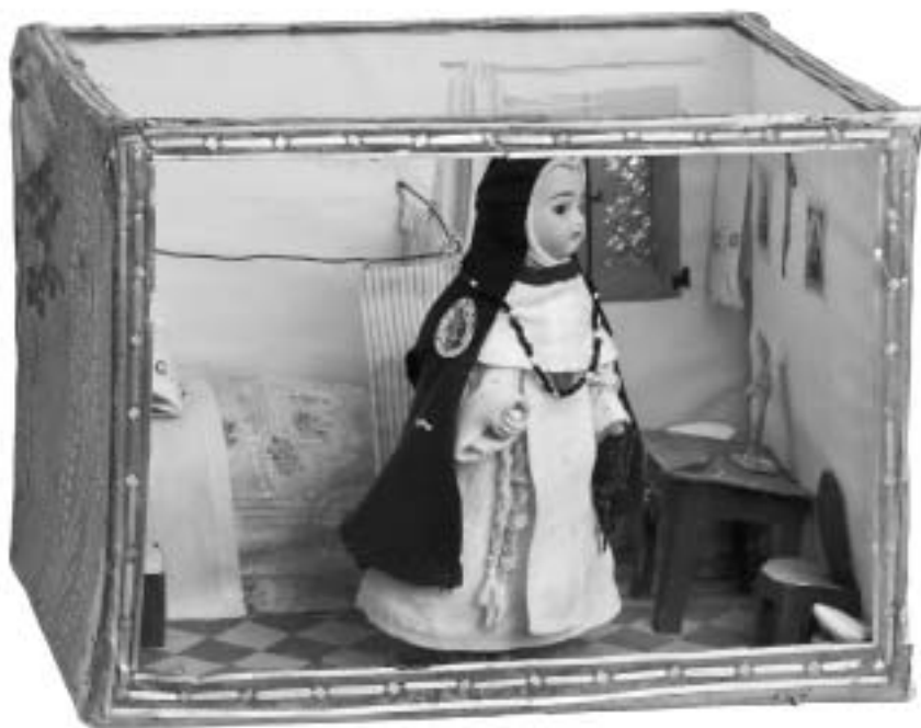
Celda de monja en miniatura de Casa Esparza, en Etayo, donada en 2004