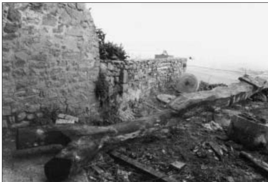
Prensa de viga en el proceso de desmontaje del trujal de Dicastillo, 2001