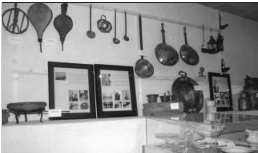
Exposición etnográfica en Zabalceta, septiembre de 2004.

bre de 2004 una interesante muestra de objetos y documentos cedidos por los vecinos.