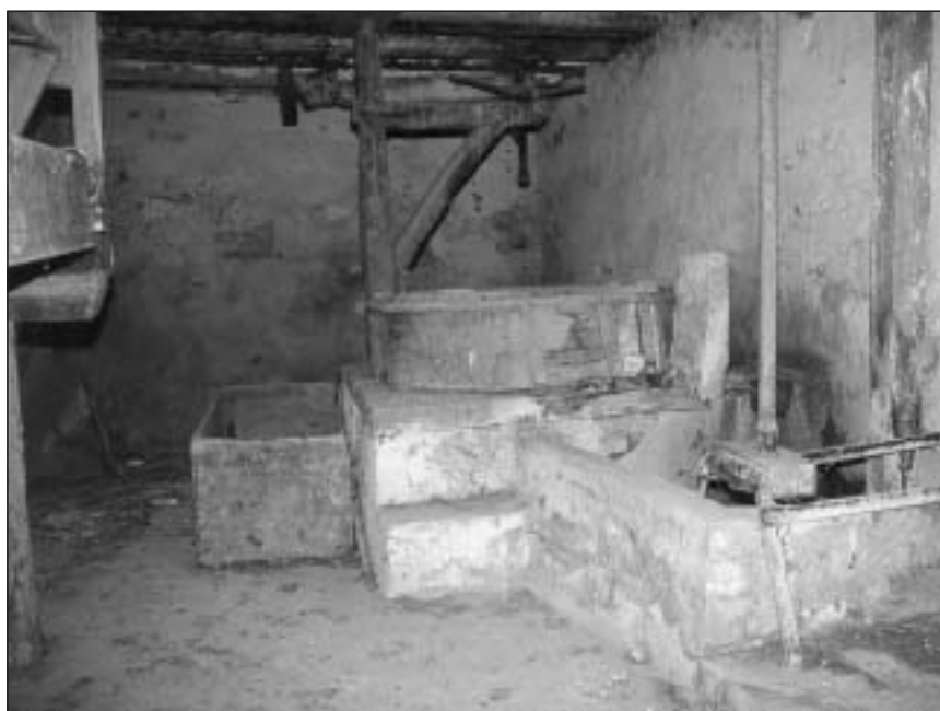
Interior del molino de Mélida en 2004