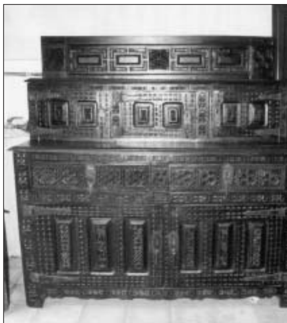
Armario aparador del siglo XVII, procedente de Casa Oroquieta en Metauten.