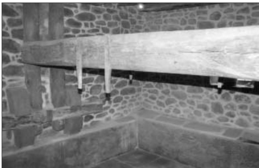
Lagar de sidra de la casa Gamioxarrea, de Arizkun