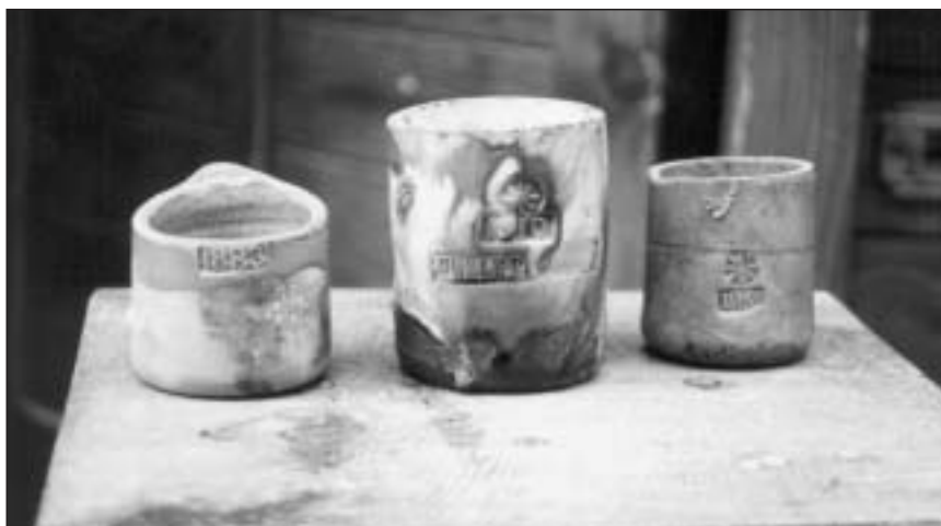
Medidas de cerámica estellesa del siglo XIX