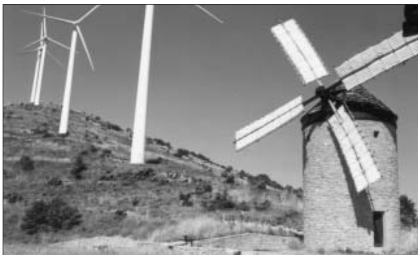
Molino de viento reconstruido en la sierra de Guerinda, San Martín de Unx