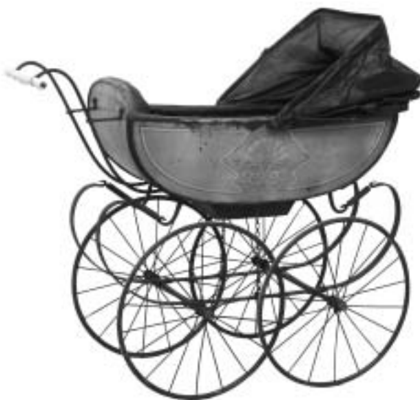
Cochecito de bebé de finales del siglo XIX