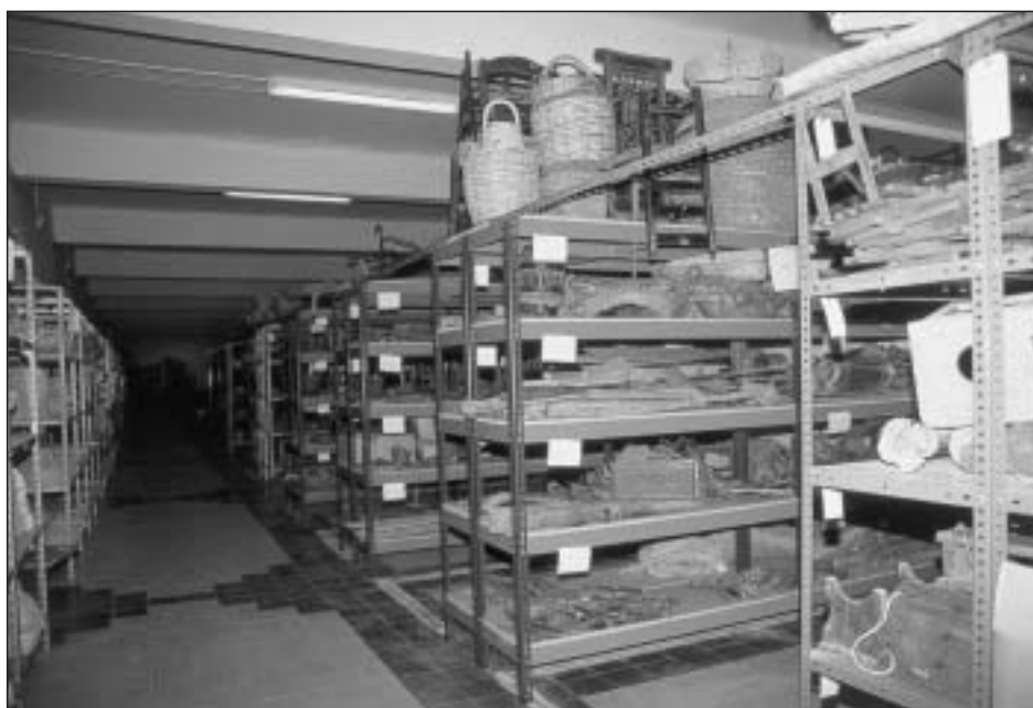
Almacenes del Museo en 2001

En cuanto a los avances realizados en el proyecto de remodelación del monasterio de Irache como Museo Etnológico de Navarra, es lamentable tener que volver a constatar que poco se ha conseguido en ese terreno a lo largo de los períodos a los que se refiere este artículo. Confiamos en que no tarden en concretarse las cuestiones esenciales que restan para asegurar una apertura pública del Museo Etnológico a corto plazo: estudio y, si fuese necesario, reajuste del programa museológico, redacción del proyecto arquitectónico y aprobación de un presupuesto específico para esta obra.