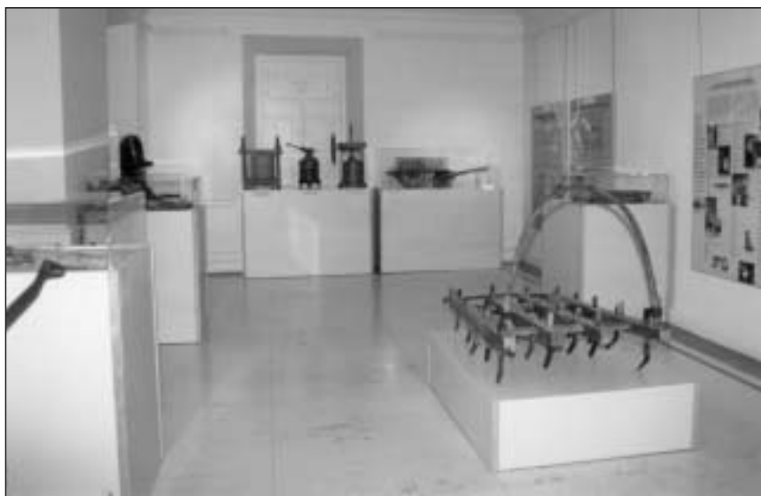
Exposición “Navarra etnográfica” en la Casa de Cultura de Elizondo, septiembre de 2001

El 19 de mayo de 2001, el Consejero de Educación y Cultura inauguró en la planta baja del monasterio de Irache la exposición “Navarra etnográfica, la conservación de la memoria”. La muestra permaneció instalada en la sede del Museo Etnológico desde la fecha mencionada hasta el 2 de septiembre y, a partir de entonces hasta finales de 2003, la exposición recorrió veinte localidades de toda la geografía de nuestra Comunidad y recibió 20.503 visitantes.