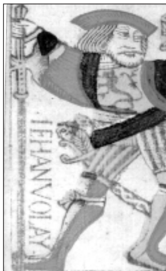
Naipes de la baraja del siglo XVI hallada casualmente en Tafalla en 2001

La Sección de Museos, Bienes Muebles y Arqueología decidió en su día adscribir a las colecciones del Museo Etnológico de Navarra una baraja de 38 naipes (en origen fueron 40), fechada en la primera mitad del siglo XVI (1516-1556) y que fue hallada casualmente en el transcurso de las obras de demolición en un inmueble de la calle Santa María, de Tafalla. El Museo Etnológico ha visto de esta manera enriquecidas sus colecciones con una pieza de singular rareza.