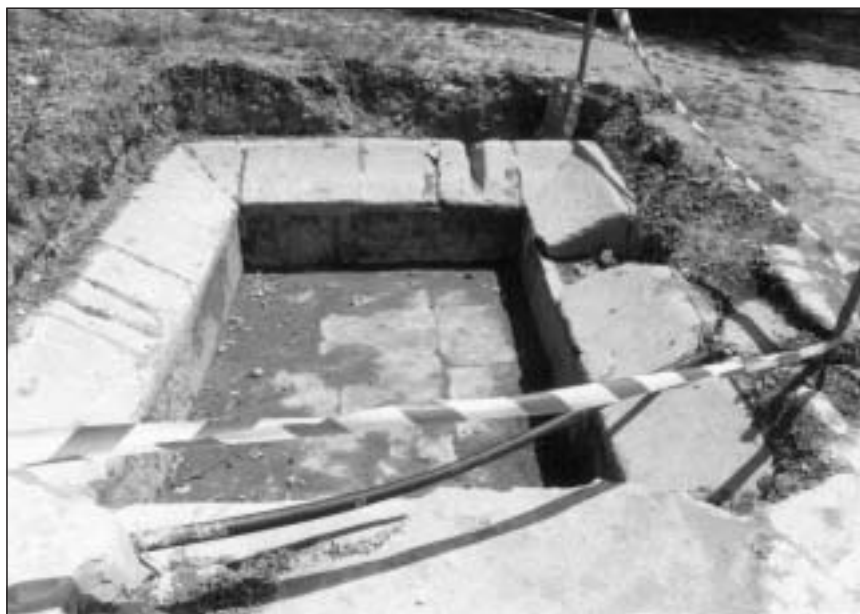
Lavadero de la fuente de La Calzada, en Azuelo, descubierto en 2002