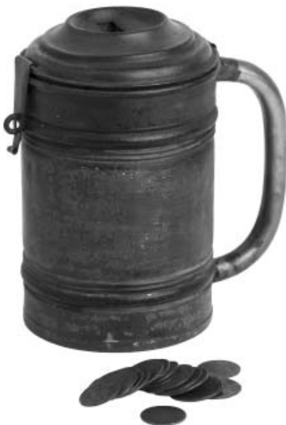
Hucha de la Casa de Misericordia de Pamplona, años 1920