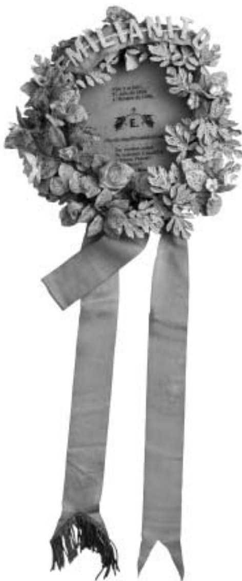
Corona fúnebre del niño Emilianito, finales del siglo XIX