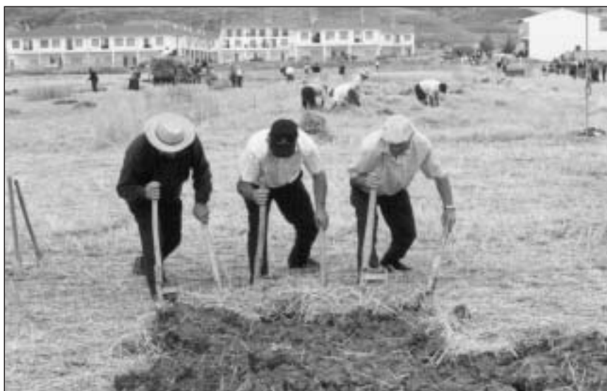
Demostración de layado en la Fiesta de Miranda de Arga de 2001