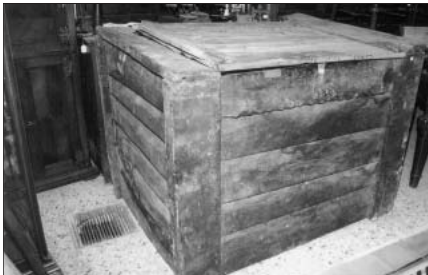
Arcón diezmero de Lakuntza