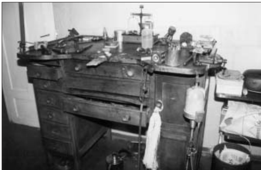
Taller del joyero Miguel Ángel Astráin