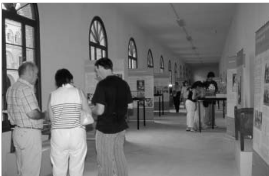
Exposición “Niños en blanco y negro” en Irache, junio de 2004

El día 26 de junio de 2004 el Consejero de Cultura y Turismo inauguró en la planta baja del monasterio de Irache la exposición itinerante “Niños en blanco y negro: la infancia en la sociedad tradicional de Navarra”.