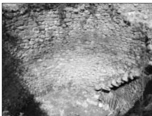
La “nevera” de Burgui antes de su restauración, en 2003