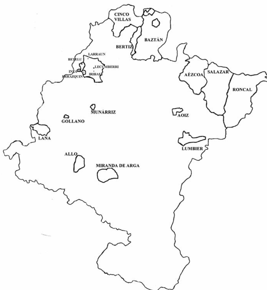
Mapa 1. Extensión de la hidalguía colectiva en Navarra

lles montañoses de Lana (1271), Larráun (1497), Bértiz (1429), Cinco Villas, Baztán (1440), Aézcoa (1462), Salazar (1469) y Roncal (1412) (Fortún et alii , 1989: 128) 21 .