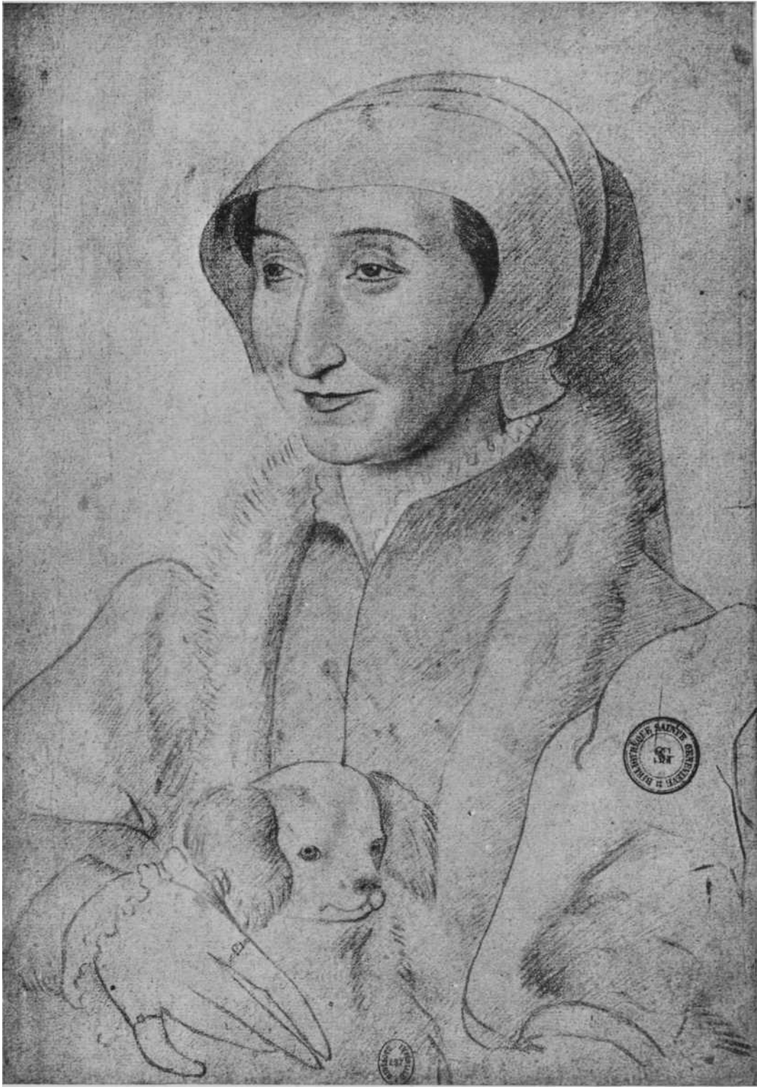
Margarita de Valois, reina de Navarra, hermana de Francisco I