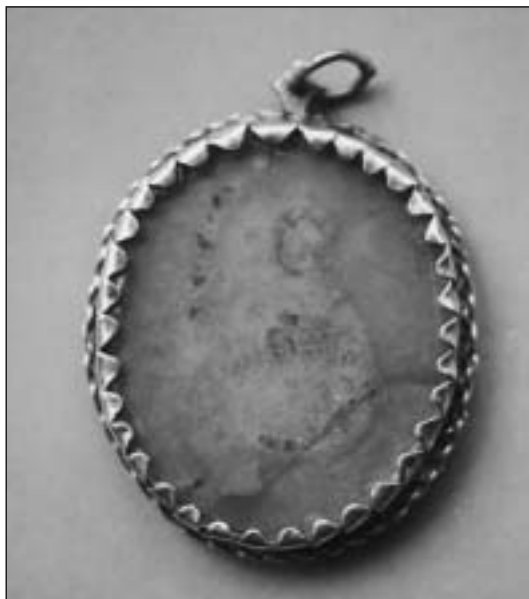
Pieza nº 7.007, medallón de plata con un “agnusdei” en el interior