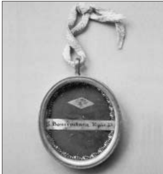
Relicario nº 7.008, medallón de plata conteniendo una reliquia de San Buenaventura, obispo y doctor de la Iglesia