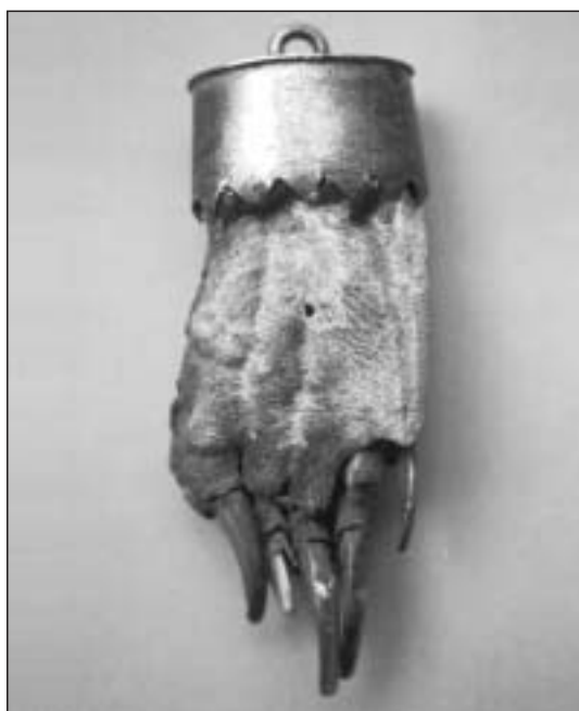
Amuleto nº 7.003, una garra de tejón engastada en plata

Datación/vigencia: La vigencia de este amuleto se documenta entre los siglos XV a finales del XIX.