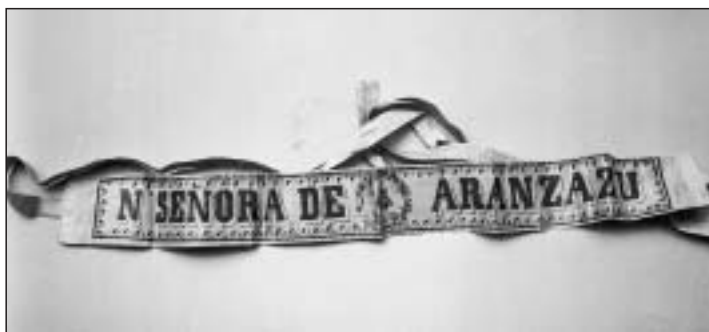
Pieza nº 7.009, cinta de seda de Nª Señora de Aránzazu