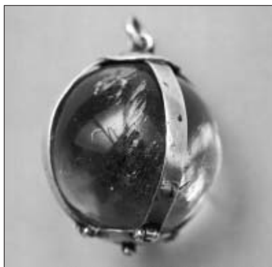
Amuleto nº 7.005, esfera de cristal de roca translúcido

Datación/vigencia: Siglo XVI hasta finales del siglo XIX.