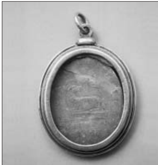
Pieza nº 7.006, medallón de plata conteniendo un “agnusdei” o tablilla de cera virgen con el Cordero Místico impreso. Datado entre 1740-1758

Datación: Papado de Benedicto XIV, entre 1740-1758.