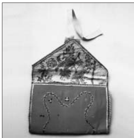
Cartera que guarda la cinta devocional de la Virgen de Aránzazu, nº 7.009

Datación: Siglo XIX-primer tercio del XX.