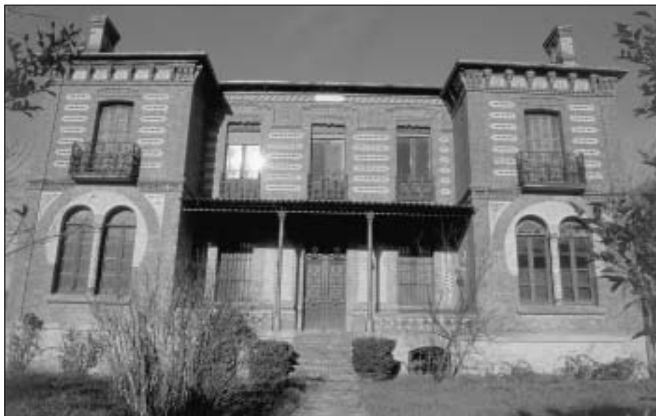
Lám. 16. Murillo de Lónguida. Villa Lónguida o Casa del Americano

que recrea el empleo de ladrillo mediante taqueados o con su disposición saliente en punta, de manera que el conjunto puede ponerse en contacto con algunos proyectos catalanes y aragoneses de finales del siglo XIX interpretados en clave neomudéjar como el pabellón árabe de los baños de Alhama de Aragón (Zaragoza). Villa Lónguida se convierte así en una de las mejores muestras de arquitectura pictórica o cromática de Navarra.