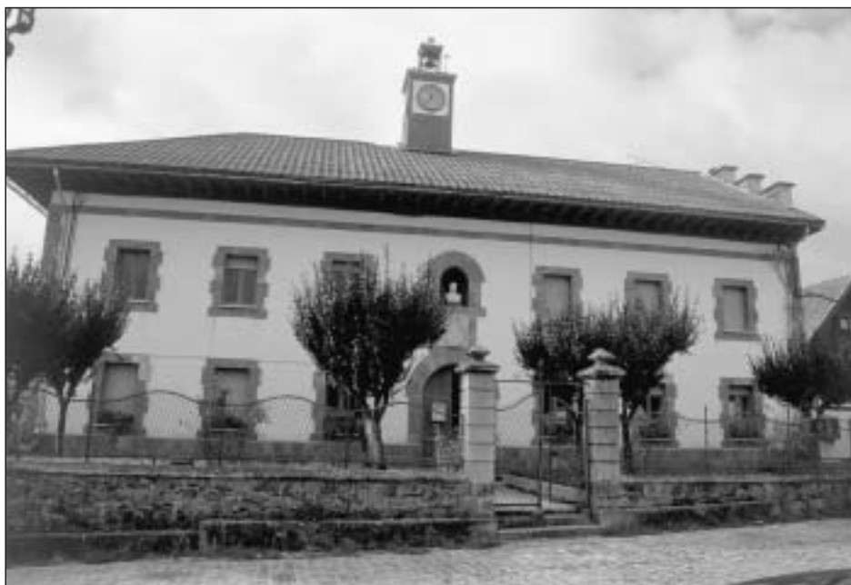
Lám. 30. Garayoa. Casa Consistorial.