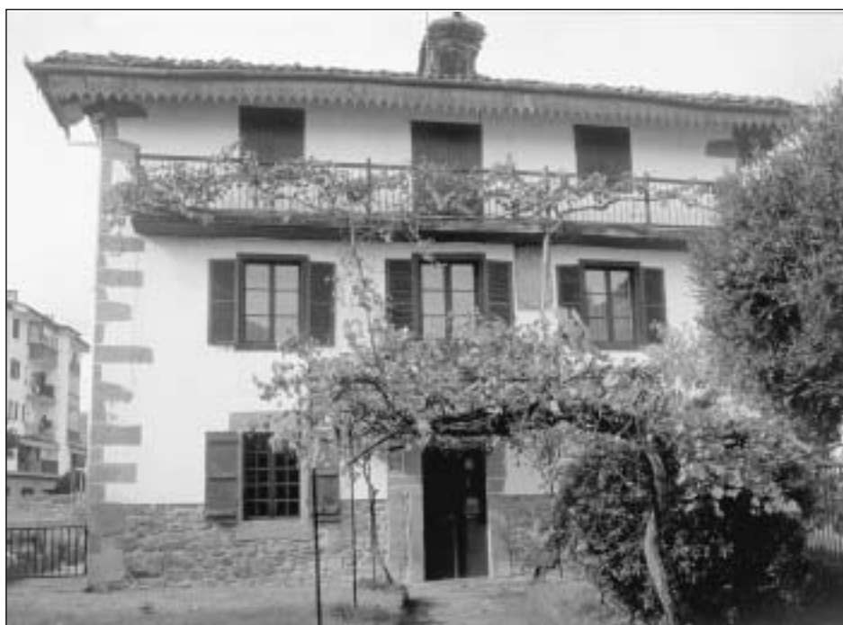
Lám. 7. Elizondo. Casa Martindenea