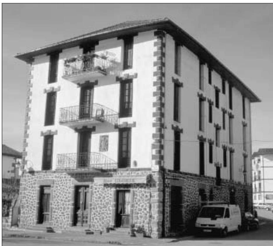
Lám. 8. Elizondo. Casa Leku-Eder o Perochena