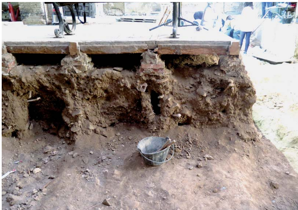
Figura 1. Sección de terreno no excavado de la nave central de la iglesia de San Nicolás en la que pueden observarse las tablas originales, que cubrían el suelo, los espacios que correspondían con el cajeadado, no delimitado, y las capas de tierra mezcladas con restos de huesos desordenados fruto del rompimiento.

El precio por un «zabullimiento» fue cambiando, en ocasiones incluso se anunciaba en tablas en la misma iglesia. Costaba entre 1 y 2 reales a mediados del siglo XVI en la diócesis de Granada, cuando por una misa en recuerdo del difunto se pagaban 40 maravedís (Guerrero, 1572/1805, p. 241). Cien años después el precio parece no haber variado (Castro & Orozco, 1868, p. 25). Si el «zabullimiento» se practicaba en capilla privada, el valor podía ascender hasta los 8 reales en esta misma época, que es lo que pagó Ana María de Henao en 1610 por ser inhumada de este modo en la iglesia madrileña de San Ginés (Sliwa, 2011, p. 21). Antolín de Santibáñez desembolsó 6 reales para recibir sepultura de este mismo modo en la capilla privada de su abuelo en la parroquia de los Santos Justo y Pastor de Madrid, en 1583 (Riandière La Roche, 1992, p. 123).