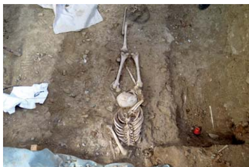
Figura 6. Posición del enterramiento 166. El cráneo carecía de continuidad anatómica y pertenecía a otro individuo.

de unos 1,63 metros (Manouvrier, 1893), y que dichas proporciones corresponden posiblemente a las de un individuo masculino (Ferembach, 1979).