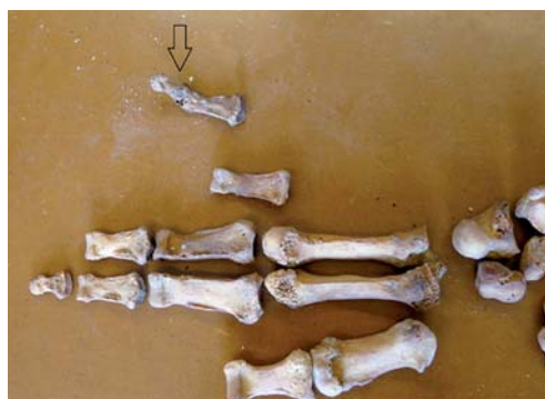
Figura 5. La flecha señala la fusión de las falanges distal e intermedia de dedo meñique.

La observación de sus vértebras lumbares, permite inferir que no había evidencias de un trabajo excesivo desempeñado a lo largo de su vida. Se aprecian algunos osteofitos en sus vértebras, pero, en general, el estado de conservación de las mismas es bastante bueno, para la edad que se le supone.