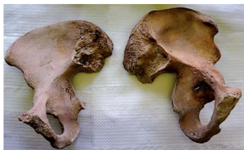
Figura 4. Comparación de la cintura pélvica de los restos de los enterramientos 47 y 44.

La imagen que aparece a la izquierda corresponde a la pelvis femenina, enterramiento 44, y la de la derecha a la masculina, enterramiento 47. La cresta iliaca de la masculina presenta