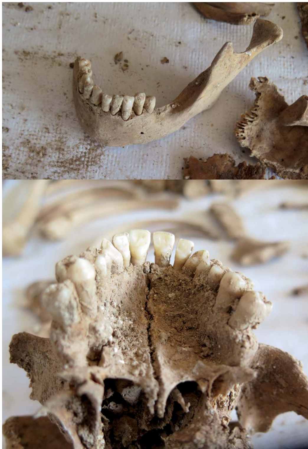
Figura 7. Mandíbula, izquierda, y dentadura del maxilar, derecha, del enterramiento 44.