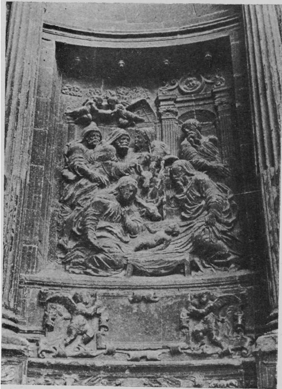
Viana.-Santa María.-Detalle de la puerta renacentista.-La Natividad.