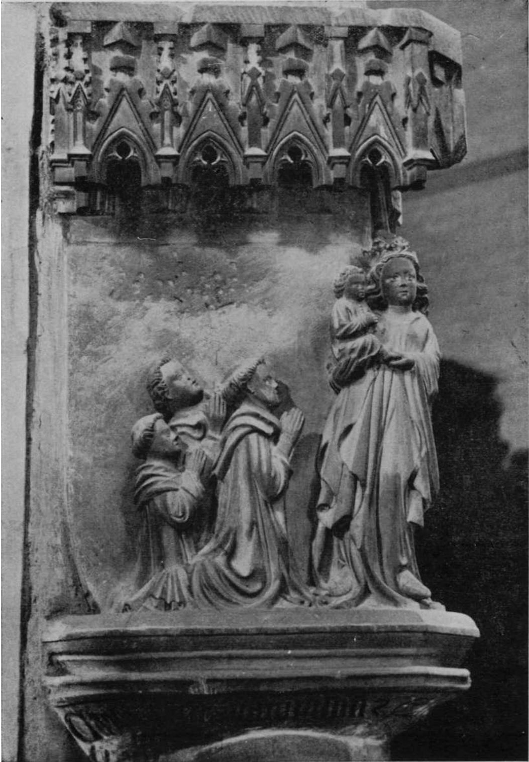
Pamplona - Catedral.—Alto relieve en el pilar de la nave central