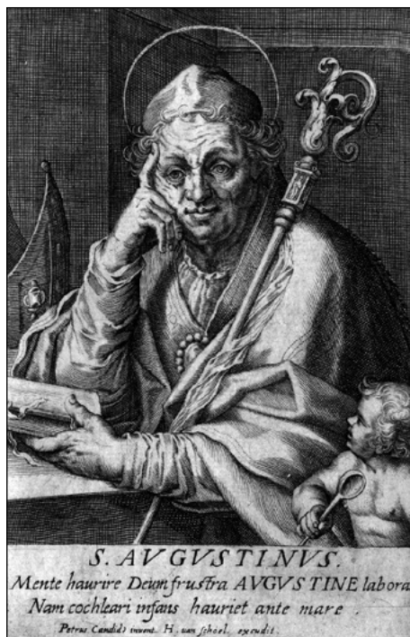
Figura 8. San Agustín , grabado de Aegidius Sadeler II a partir de una composición de Peter de Witte.