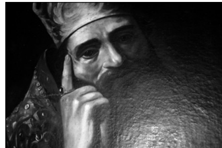
Figura 9. Claude Vignon (atribución), San Ambrosio (detalle del rostro), sacristía de los Beneficiados, catedral de Santa María, Pamplona.

sobre una mesa de madera, con claros paralelismos entre la materia pictórica y los tipos de los libros y la calavera pintados por el artista francés (fig. 7), para Pacht Bassani «una de las naturalezas muertas más bellas jamás concebidas por Vignon» 19 .