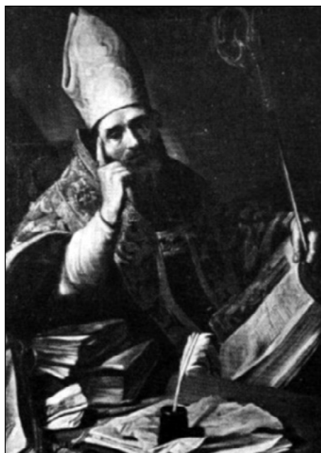
Figura 4. Claude Vignon, San Ambrosio (h. 1614-1616), Diputación de Toledo, Toledo.

Claude Vignon (Tours, 1593-París, 1670) fue un artista prolífico y longevo, además de experto tasador y marchante de pinturas y antigüedades, según refieren varias fuentes. Nacido en Tours en una familia de la pequeña nobleza, se trasladó pronto a París para completar su formación como pintor. Según su principal biógrafo, el erudito Guillet de Saint-Georges –primer historiógrafo de la Académie Royale de peinture et de sculpture– Vignon se estableció a continuación en Roma, ciudad en la que permanecería aproximadamente una década y donde abandonaría su religión calvinista para convertirse al catolicismo 7 . Al igual que otros pintores franceses de la órbita caravagesca instalados en Roma en la segunda década del siglo XVII (como