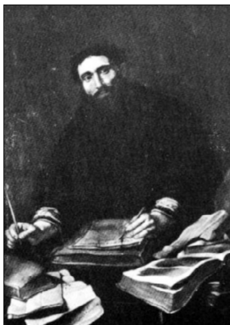
Figura 5. Claude Vignon, San Agustín (h. 1614-1616), Diputación de Toledo, Toledo.

Claude Vignon (Tours, 1593-París, 1670) fue un artista prolífico y longevo, además de experto tasador y marchante de pinturas y antigüedades, según refieren varias fuentes. Nacido en Tours en una familia de la pequeña nobleza, se trasladó pronto a París para completar su formación como pintor. Según su principal biógrafo, el erudito Guillet de Saint-Georges –primer historiógrafo de la Académie Royale de peinture et de sculpture– Vignon se estableció a continuación en Roma, ciudad en la que permanecería aproximadamente una década y donde abandonaría su religión calvinista para convertirse al catolicismo 7 . Al igual que otros pintores franceses de la órbita caravagesca instalados en Roma en la segunda década del siglo XVII (como