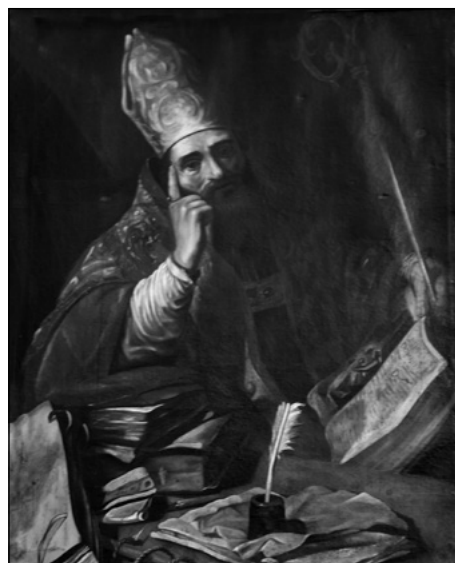
Figura 2. Claude Vignon (atribución), San Ambrosio , sacristía de los Beneficiados, catedral de Santa María, Pamplona.

fecha de ingreso de los tres lienzos en la catedral pamplonesa de Santa María resultan desconocidas a falta de menciones alusivas a las obras o documentos de archivo, por lo que el presente estudio se basa en los rasgos estilísticos e iconográficos de los cuadros de los dos doctores de la Iglesia latina.