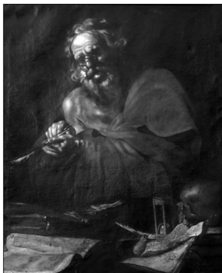
Figura 1. Claude Vignon (atribución), San Jerónimo , sacristía de los Beneficiados, catedral de Santa María, Pamplona.