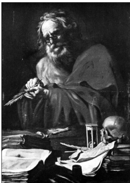
Figura 3. Claude Vignon, San Jerónimo (h. 1614-1616), Diputación de Toledo, Toledo.