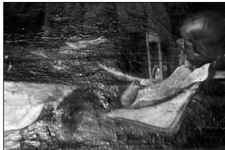
Figura 7. Claude Vignon (atribución), San Jerónimo (detalle de naturaleza muerta), sacristía de los Beneficiados, catedral de Santa María, Pamplona.