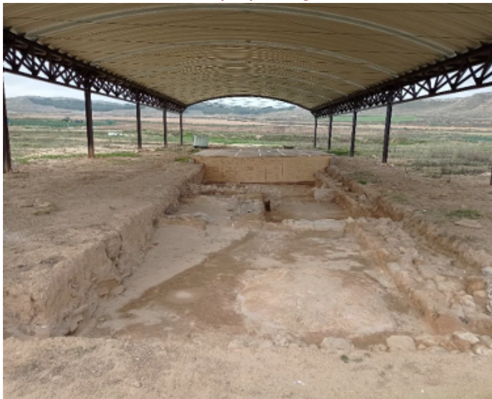
Vista de la zona antes de excavar / Eremuaren ikuspegia indusketa hasi aurretik