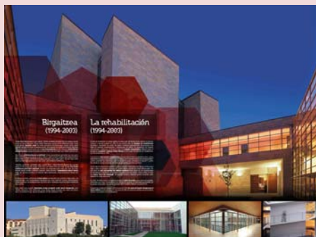
REHABILITACIÓN Y NUEVAS INSTALACIONES