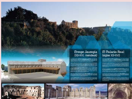
EL PALACIO REAL EN SU HISTORIA

En la galería baja se instaló una exposición permanente, formada por ocho paneles, en los que a través de imágenes de fuerte contenido visual y textos claros y sintéticos se ofrece una completa visión sobre el AGN en los siguientes aspectos: