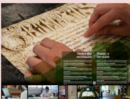
MISIÓN, SERVICIOS Y DIFUSIÓN