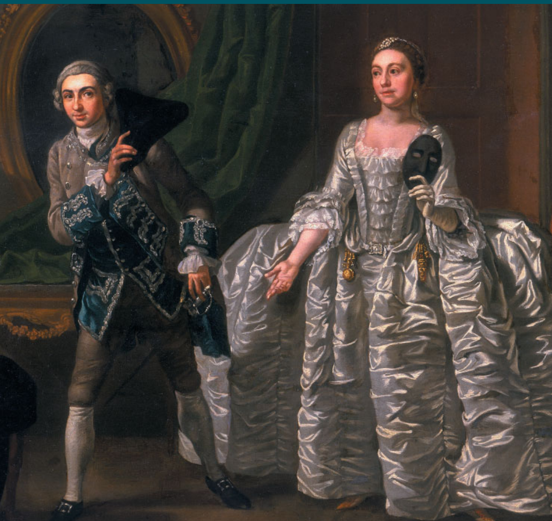
Francis Hayman (1708-1776). 'David Garrick and Hannah Pritchard in a Scene from "The Suspicious Husband"', 1752.

VII FESTIVAL DE TEATRO CLÁSICO DEL 21 DE JULIO AL 6 DE AGOSTO DE 2006