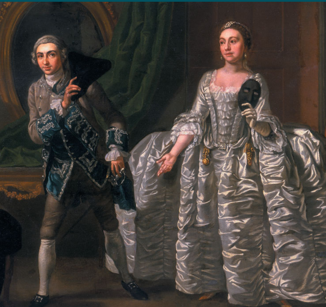
Francis Hayman (1708-1776). 'David Garrick and Hannah Pritchard in a Scene from "The Suspicious Husband"', 1752.

VII FESTIVAL DE TEATRO CLÁSICO DEL 21 DE JULIO AL 6 DE AGOSTO DE 2006