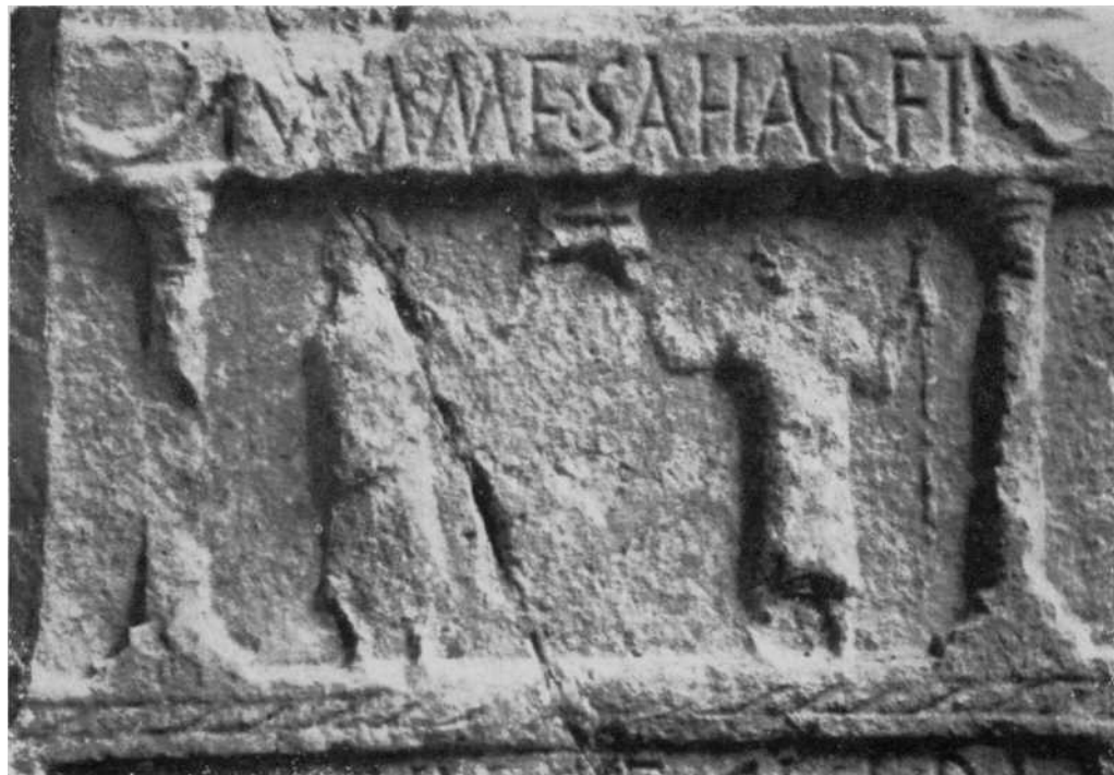
Museo de Navarra.—Lápida romana de Lerga.—Detalles