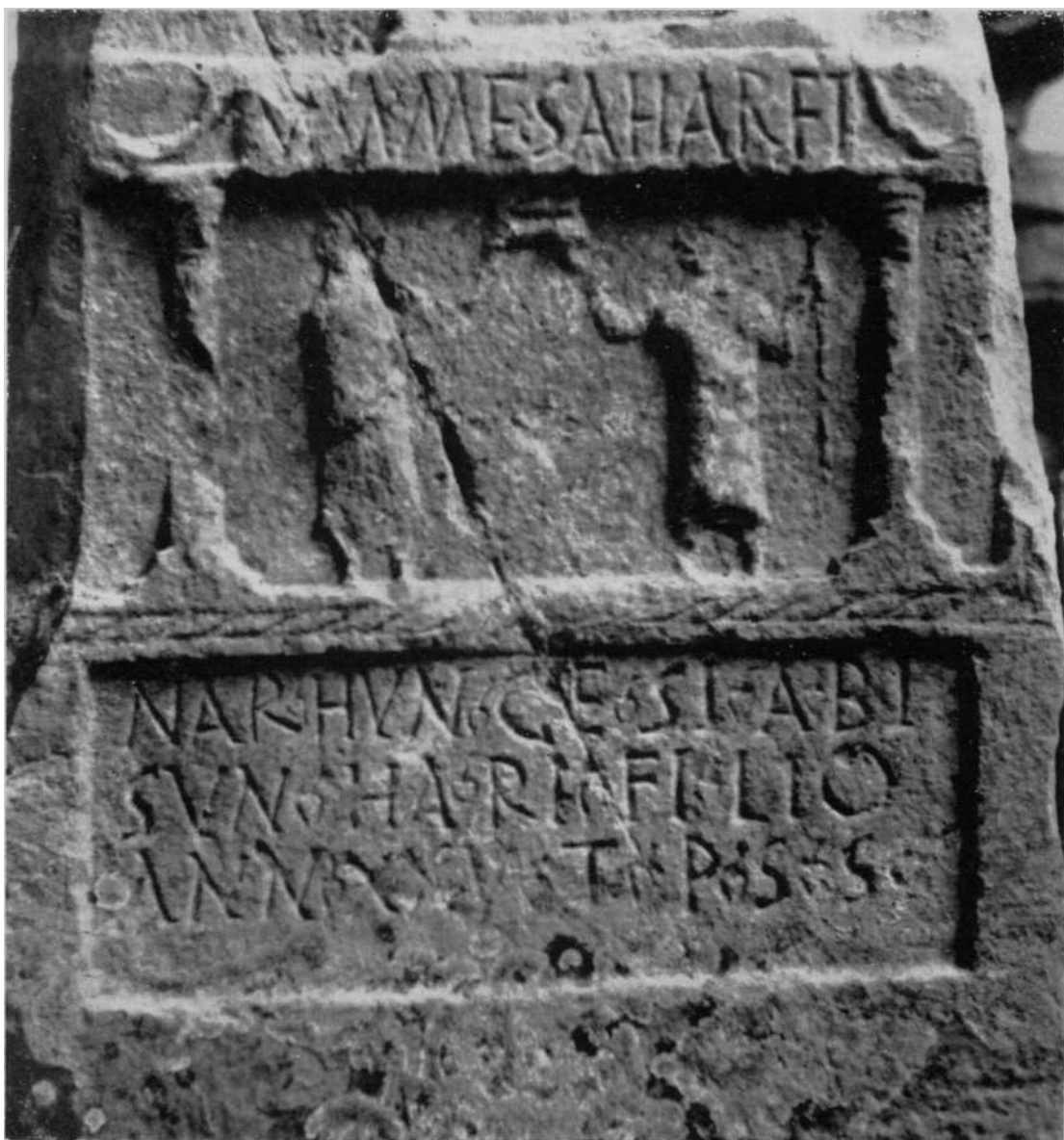
Museo de Navarro.—Lápida romana de Lerga.—Detalle