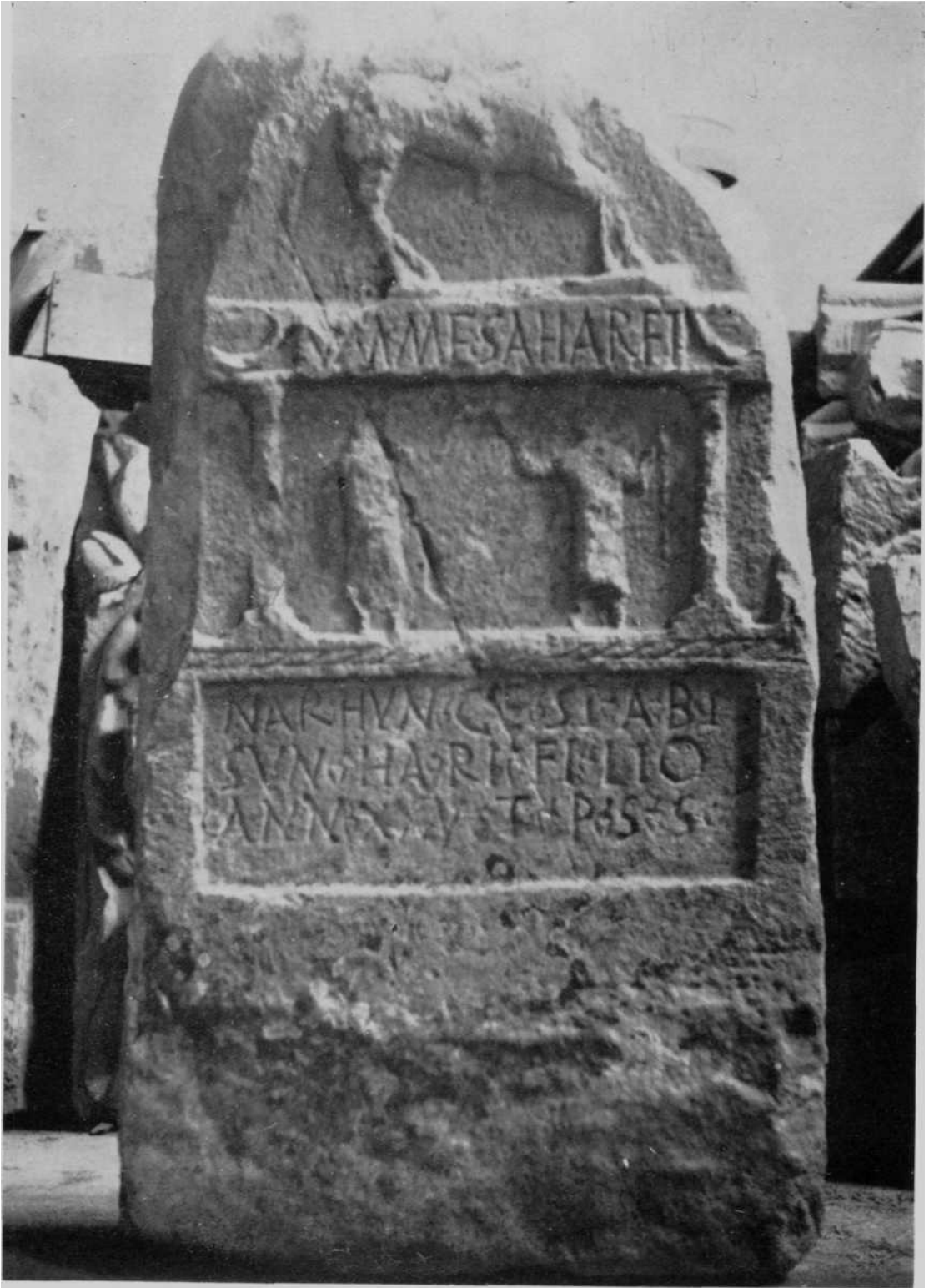
Museo de Navarra —Lápida romana de Lerga