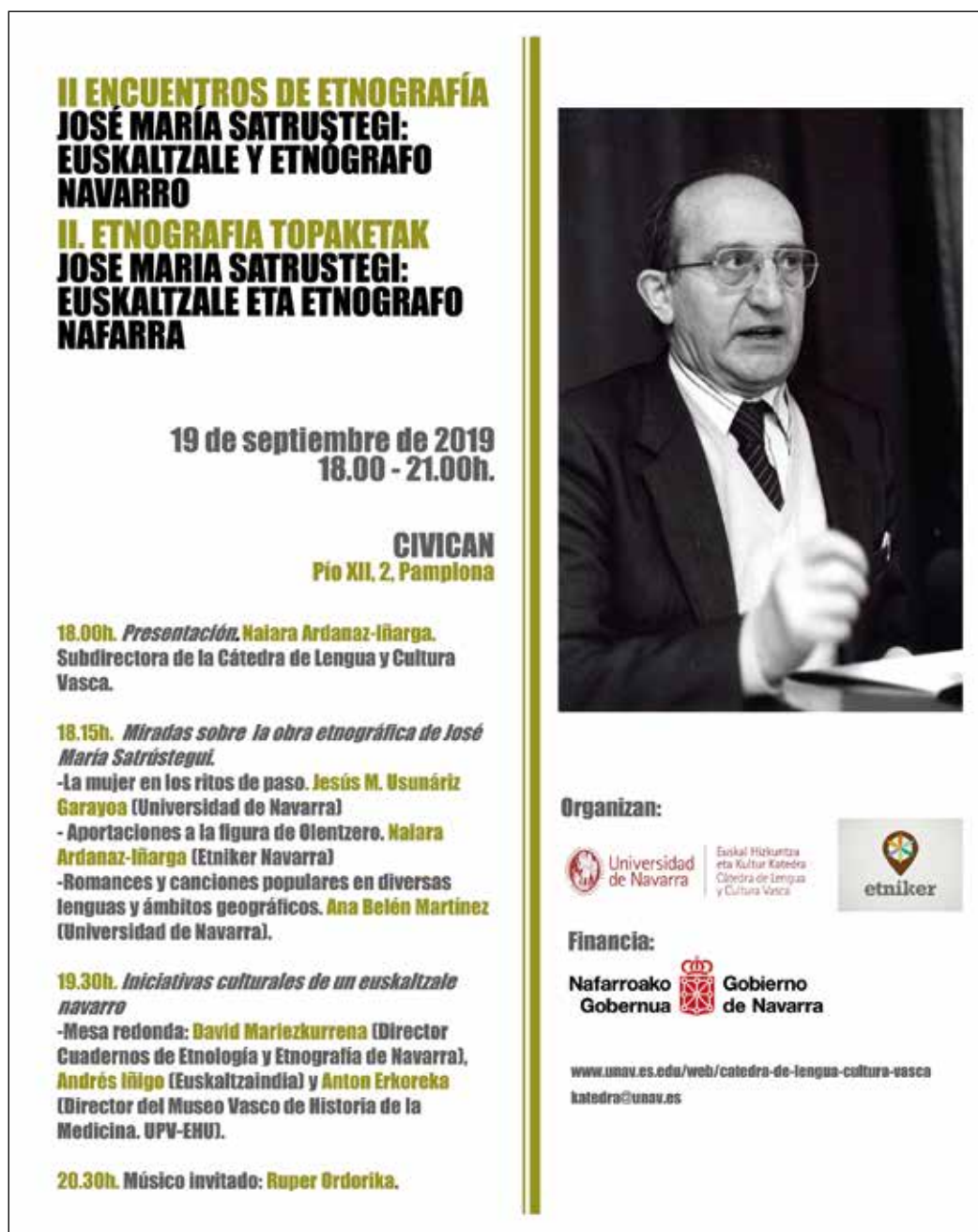
Figura 1. Cartel anunciador de los II Encuentros de Etnografía.

La segunda intervención, impartida por Naiara Ardanaz, subdirectora de la Cátedra, versó sobre la figura de Olentzero y las aportaciones a este tema de sus principales investigadores, como el padre Donostia, Barandiaran, Pío Baroja, Azkue, Caro Baroja o el propio Satrustegi. Este personaje mítico destaca por la gran riqueza y variedad de costumbres y creencias vinculadas con las celebraciones del solsticio de invierno, el