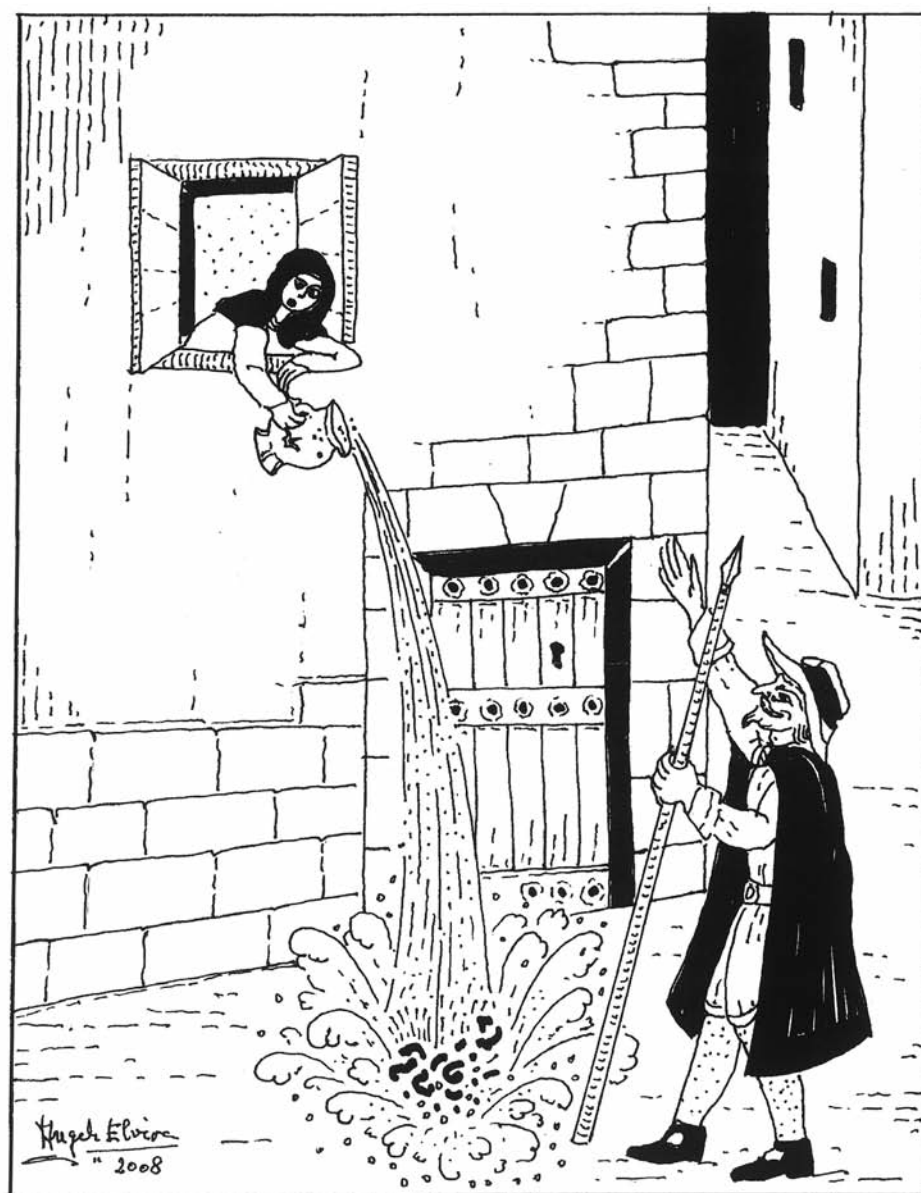
SUCIEDAD EN LAS CALLES.