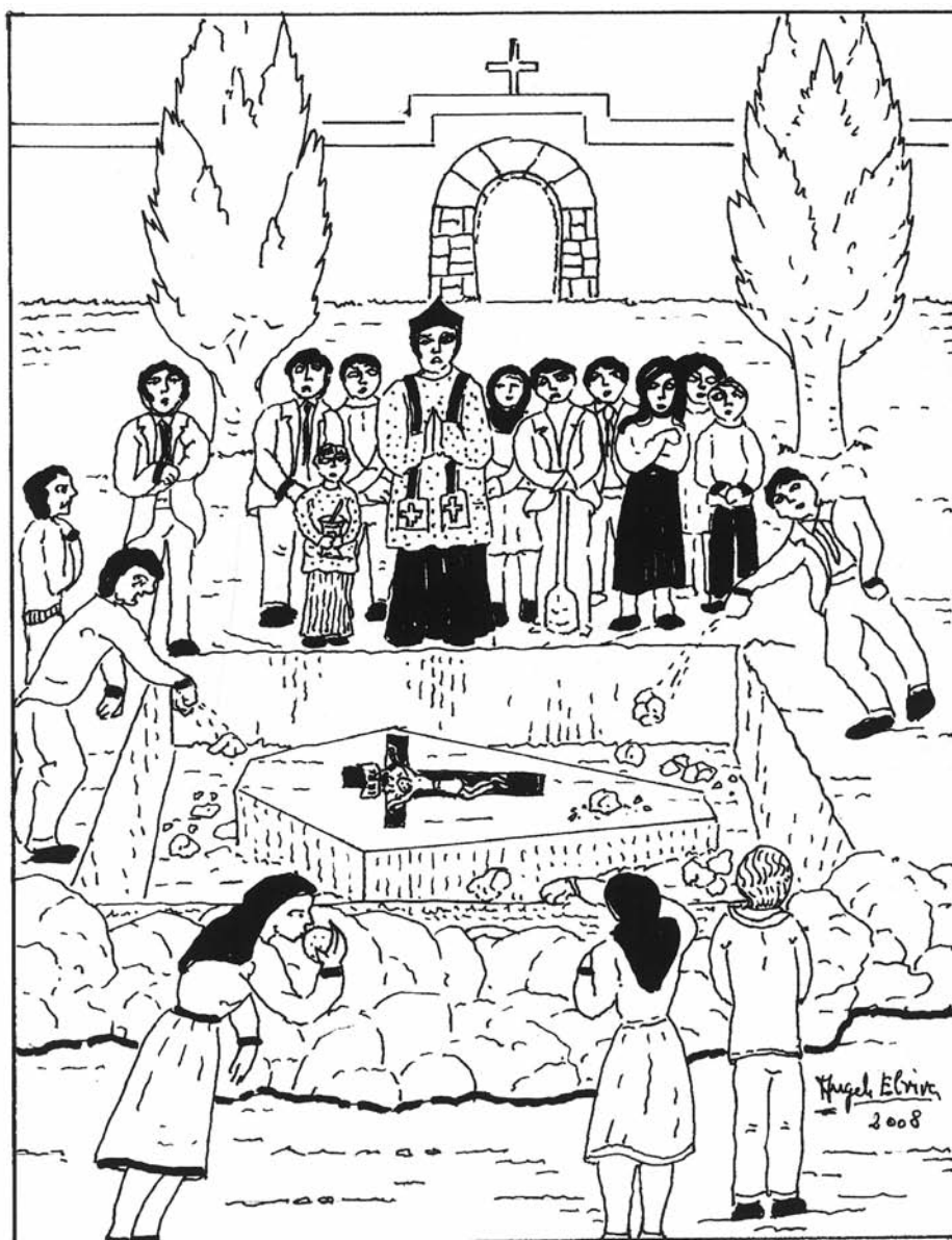
TIERRA BESADA A LA FOSA.