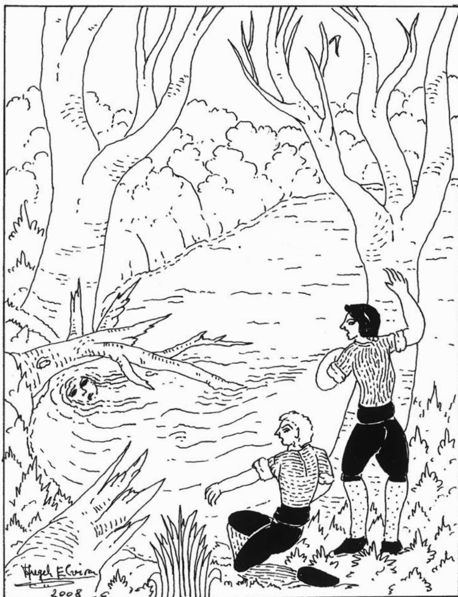
AHOGADA EN EL EBRO.