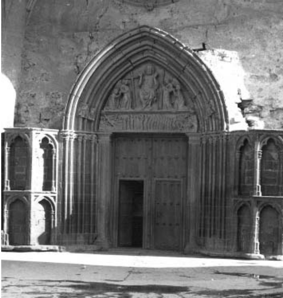
Atrio de San Salvador.