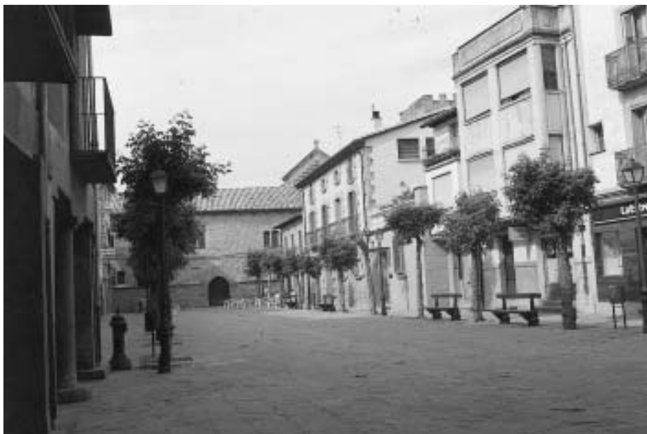
Plaza del Castillo, La Galería.