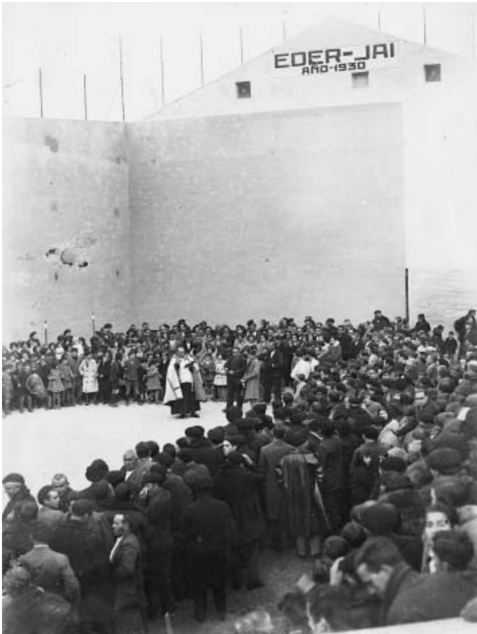
Bendición del frontón Eder-Jai.