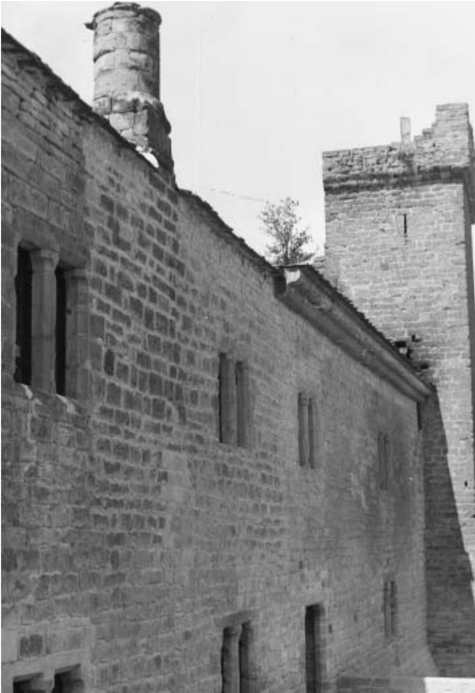
Fosos del palacio-castillo.