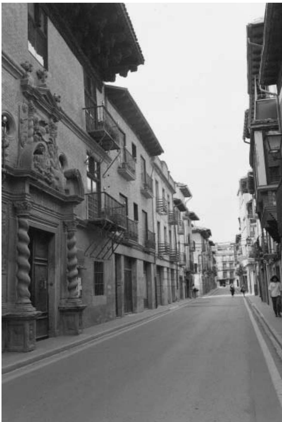
Calle Mediavilla y en primer término el palacio de Juan Echeverri y Echenique.