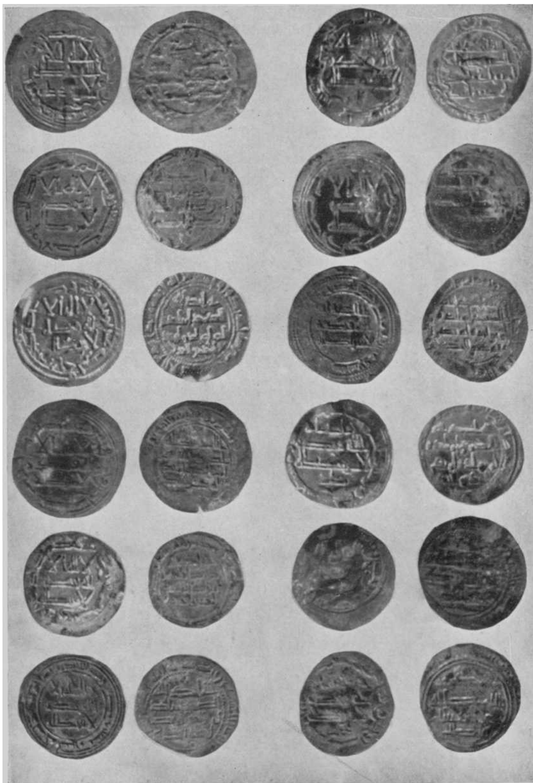
Dirhemes del Emirato, en la última línea el primero, de la reforma de 219; el segundo de los rebeldes de 235 A. H. (834 y 849 J. C.)