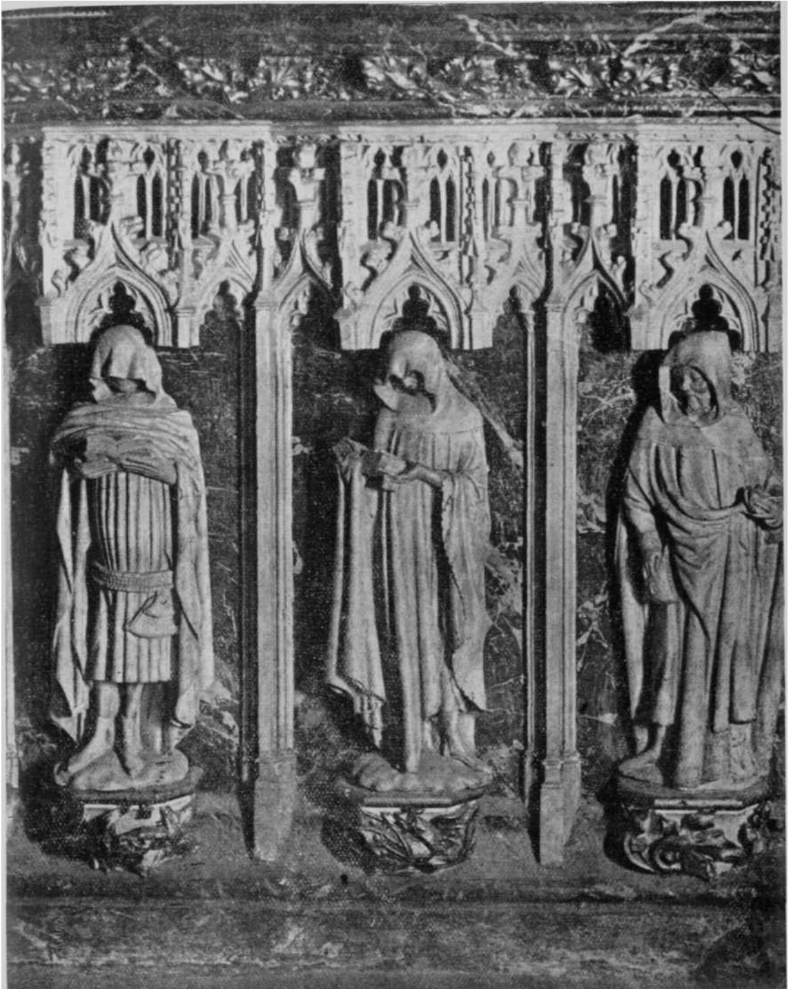
Catedral de Pamplona.—Sepulcro de Carlos III el Noble