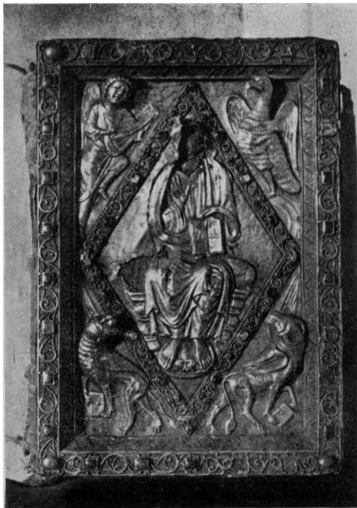
Evangelario de la Colegiata de Roncesvalles. — 1. a cubierta