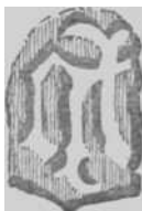
Punzón de la ciudad en el Evangelionario de Pamplona

miento, señala la anatomía del torso, apareciendo los pies cruzados y sujetos con un solo clavo. A los lados de la Cruz se encuentran las figuras de la Virgen y San Juan, aquélla con las amplias y pesadas vestiduras de las Vírgenes representadas por la escuela flamenca de pintura y miniatura, y la de San Juan con un más suave plegado de paños, corta y rizosa melena y sin nimbo; su proporción es algo mayor y más esbelta que la de María Santísima, más próxima por lo tanto al arte italiano. Clavada en el madero, la inscripción infamante, INRI, va encerrada en rizada cartela; y sobre los brazos de la Cruz, las figuras del Sol y de la Luna en sus verdaderas formas. Todo el fondo se rellena de la decoración renaciente de que se hizo mención para la cubierta anterior.