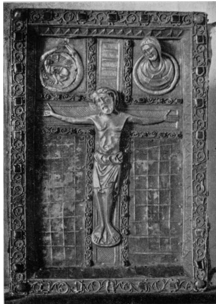
Evangelario de la Colegiata de Roncesvalles. — 2. a cubierta