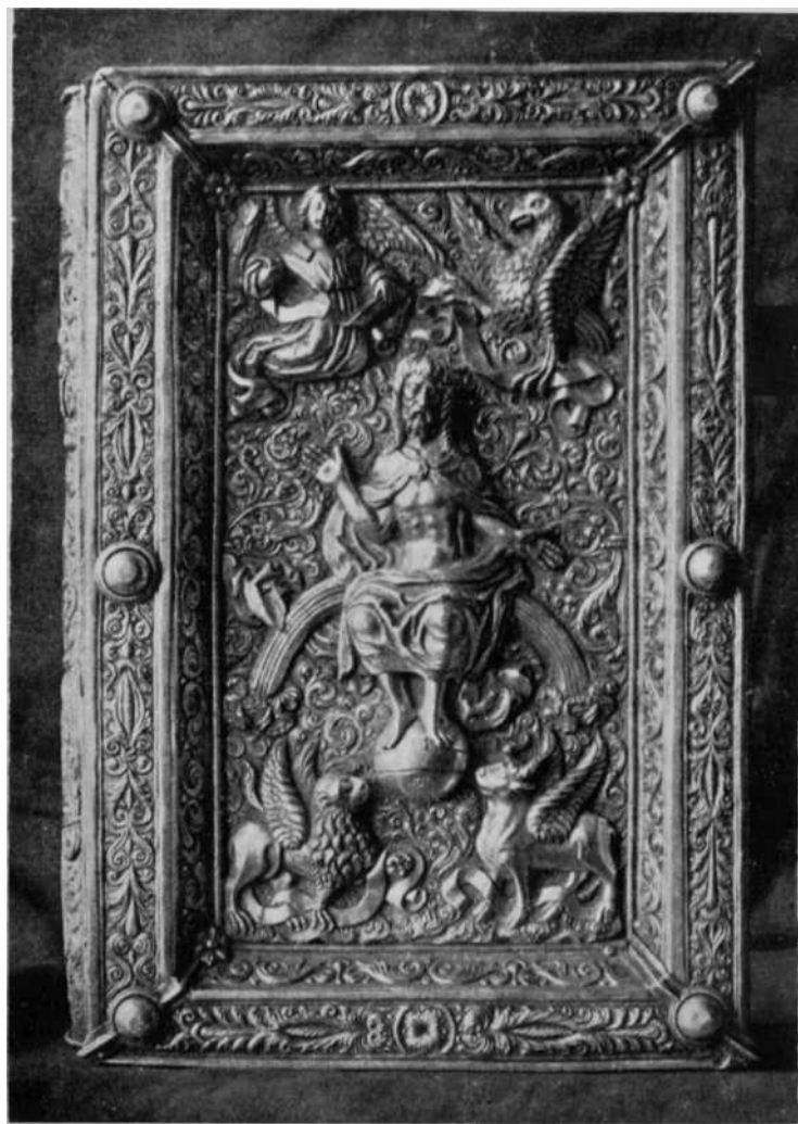
Evangelario de la Catedral de Pamplona 1. a cubierta