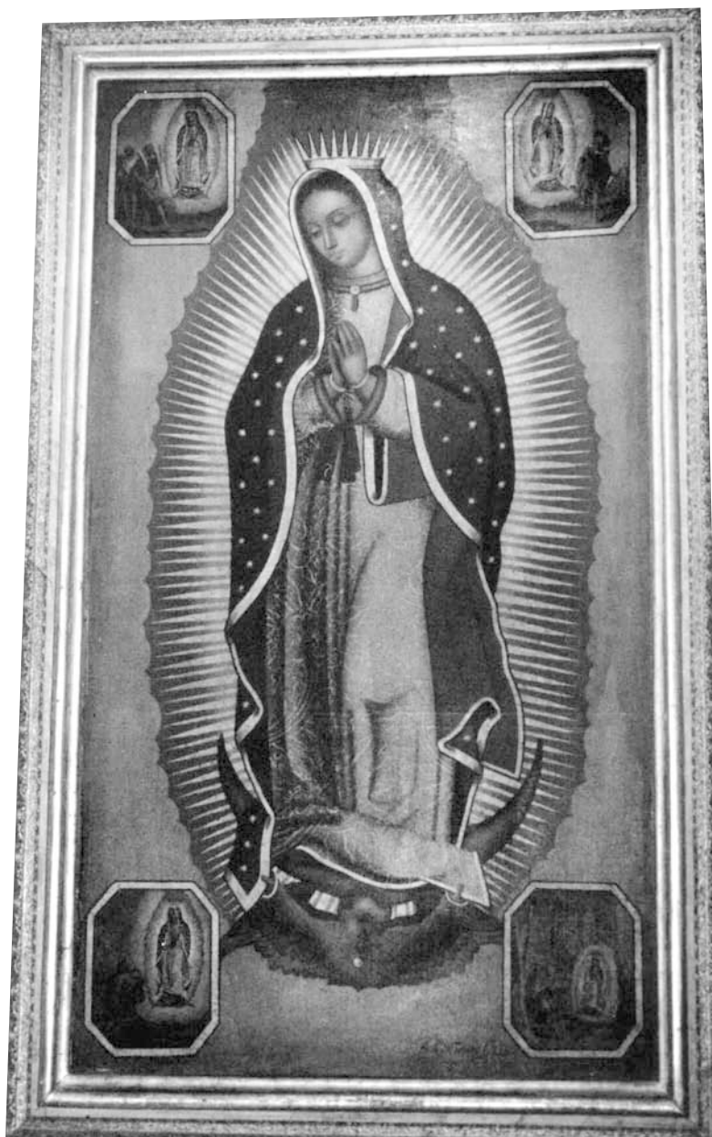
Lám.5. Virgen de Guadalupe. Basílica de la Trinidad de Arre