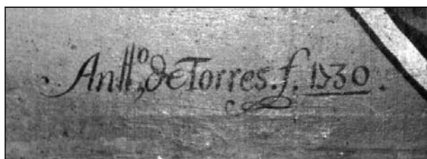
Lám.4. Virgen de Guadalupe. Firma del pintor. Basílica de la Trinidad de Arre