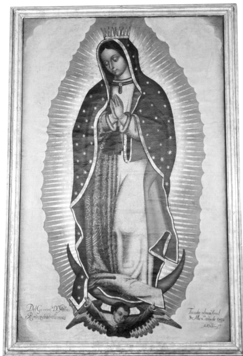
Lám. 1. Virgen de Guadalupe. Museo Decanal de Tudela

En la parte inferior lleva inscripciones. A la izquierda: “Del General Dn. Pedro / Ramirez de Arellano=”; a la derecha: ”Tocada a la original / de Mexco. Año 1711=”; “Antto. De Torres fit” (Láms. 2 y 3).