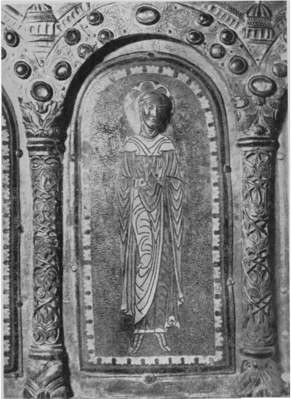
Placa de la Virgen de la Anunciación, del Retablo de San Miguel in Excelsis, en el Aralar.