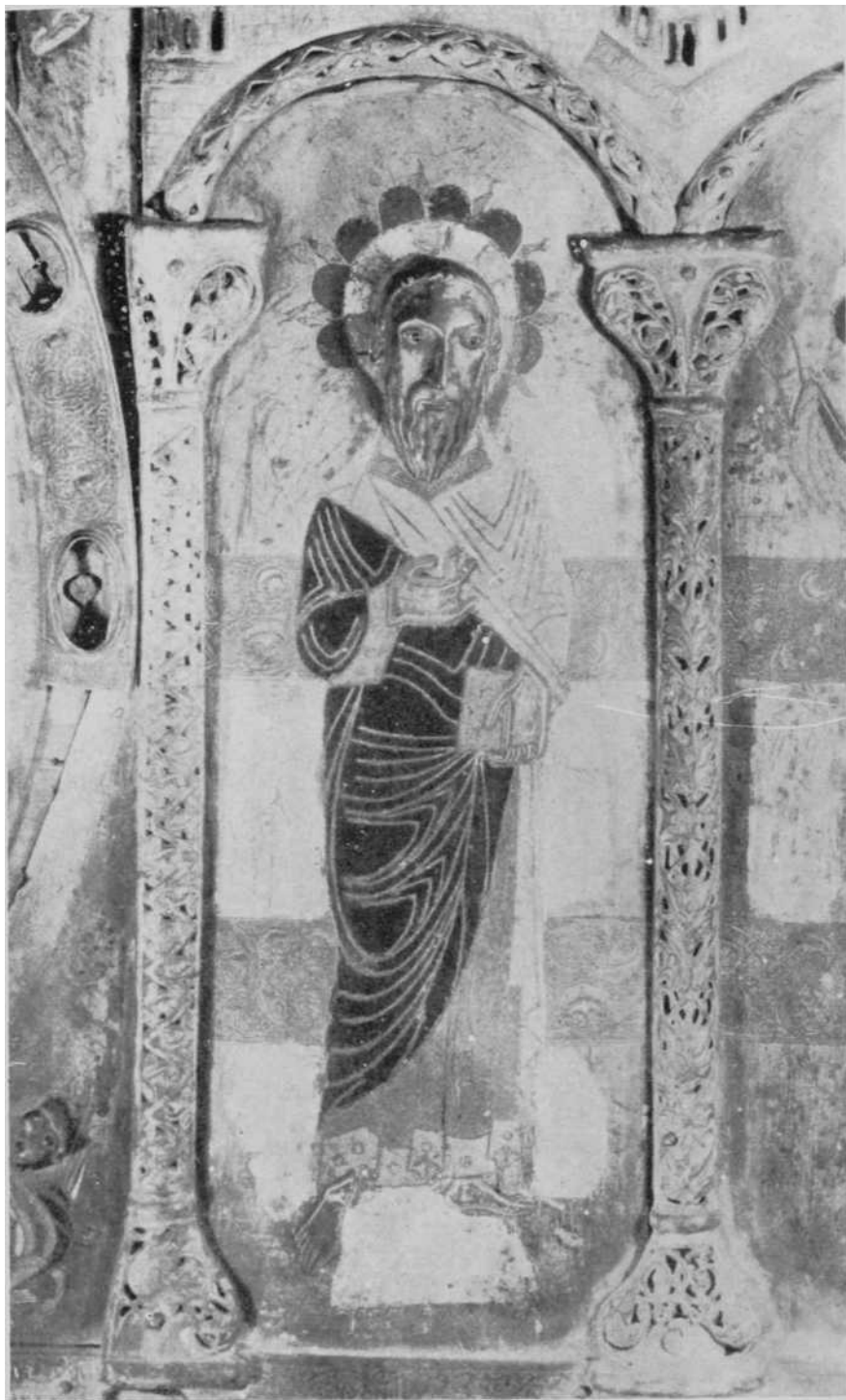
Detalle de «un apóstol» del llamado «Frontal de Silos».