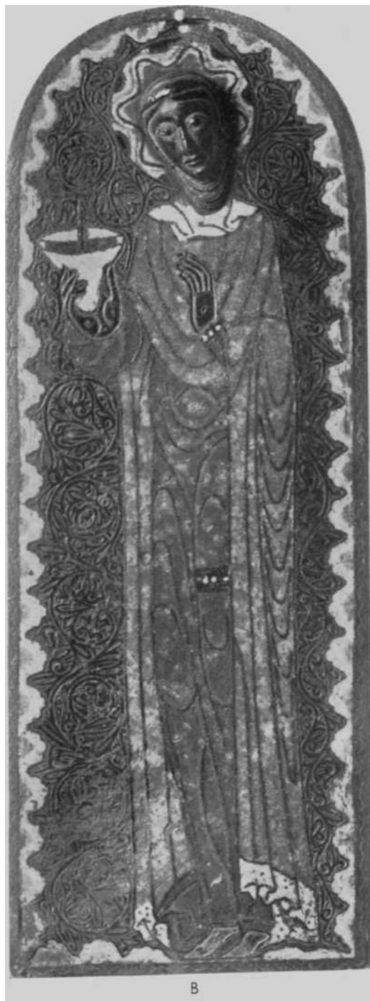
Placas representando «Las Vírgenes Prudentes» A—Del Museo Nacional de Florencia. B—Del Museo Arqueológico de Viena.