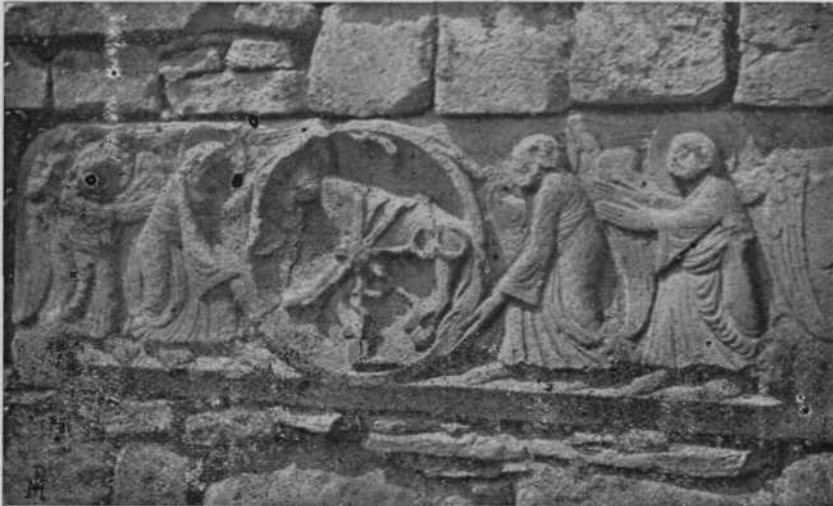
UNCITI.-Restos del dintel de la antigua capilla de Erraondo