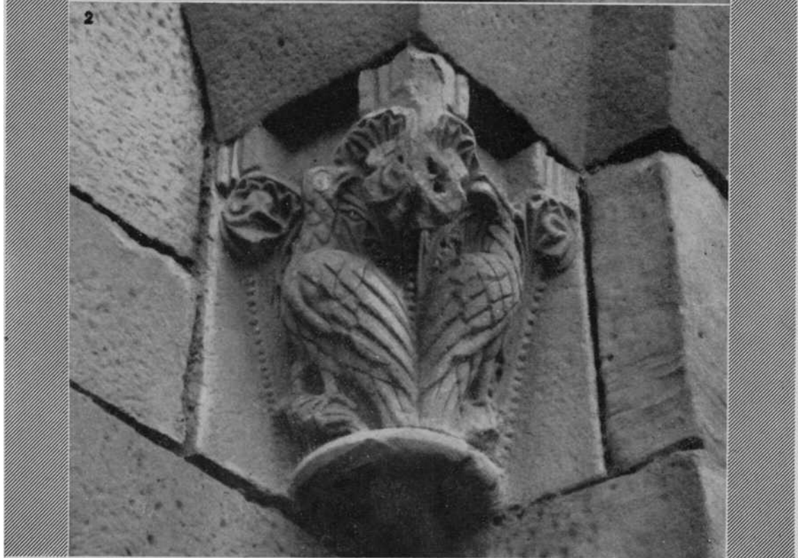
AGUILAR DE CODÉS.—Ermita de San Bartolomé. Capiteles de la puerta